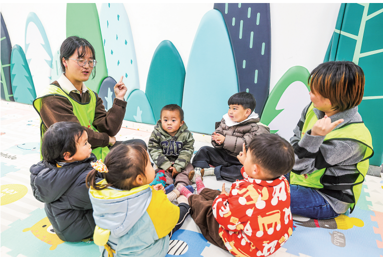
在浙江省杭州市临安区太阳镇邻里中心，婴幼儿成长驿站内，青年志愿者带着孩子在玩耍。

其中，广东探索出“共享家长 邻里互助”的临时托模式，受到年轻父母欢迎。针对临时托需求大但供给不足的实际，当地计生协通过线上平台让富有余力、感情相