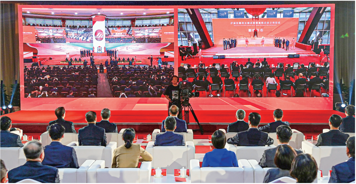
▲4月10日,在沪深交易所主板注册制首批企业上市仪式北京分会场,与会嘉宾通过屏幕实时观看沪深两地交易所上市仪式。当日,沪深交易所主板注册制首批企业上市仪式在北京、上海、深圳三地连线开展。上午9时30分,10家企业正式在沪深主板上市交易。(详细报道见3版)