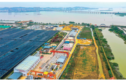
这是深(圳)江(门)铁路珠江口隧道广州南沙段盾构起始点(4月10摄)。目前珠江口隧道盾构段已掘进过半。