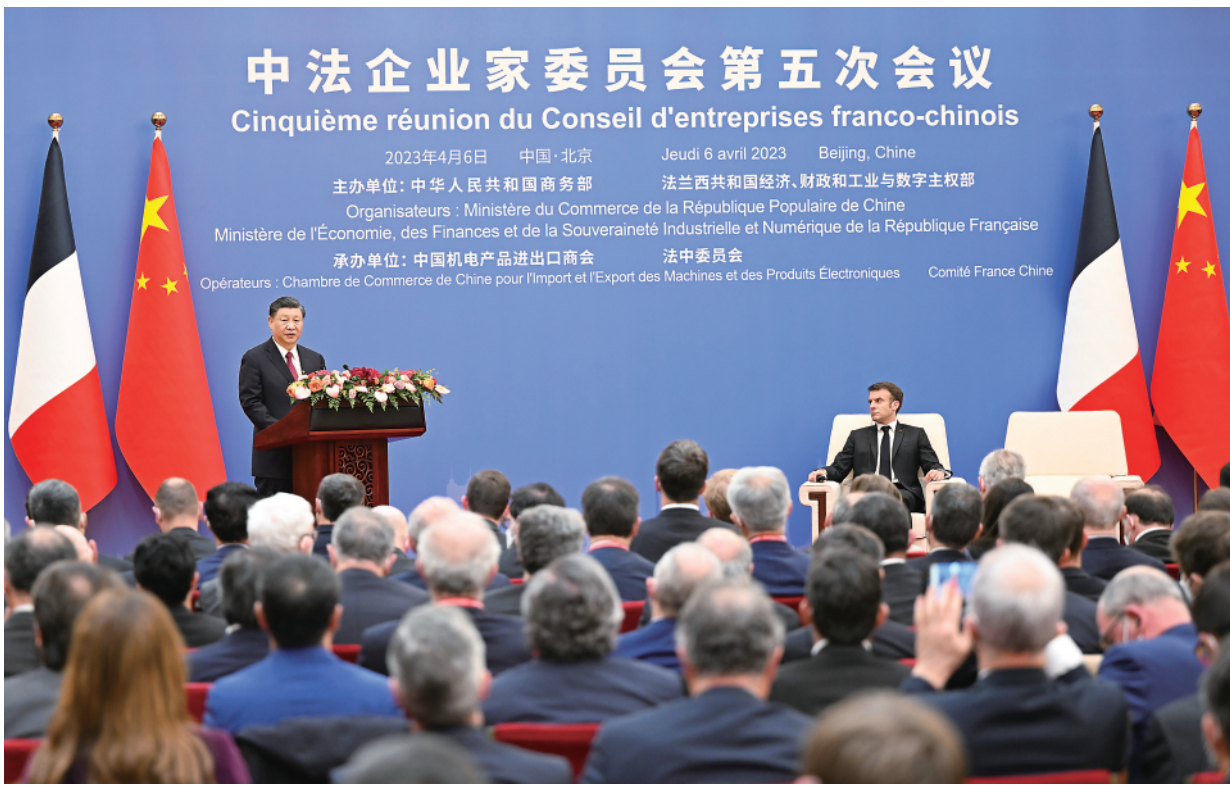
▲4月6日下午,习近平主席在北京同法国总统马克龙共同出席中法企业家委员会第五次会议闭幕式并致辞。

新华社北京4月6日电(记者刘华)4月6日下午,国家主席习近平在北京同法国总统马克龙共同出席中法企业家委员会第五次会议闭幕式并致辞。