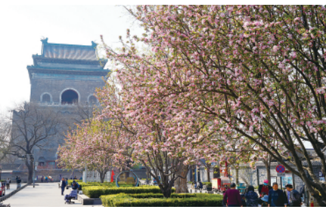
3月31日拍摄的鲜花掩映下的北京钟楼。春风送暖，北京处处春花绽放，姹紫嫣红，美不胜收。