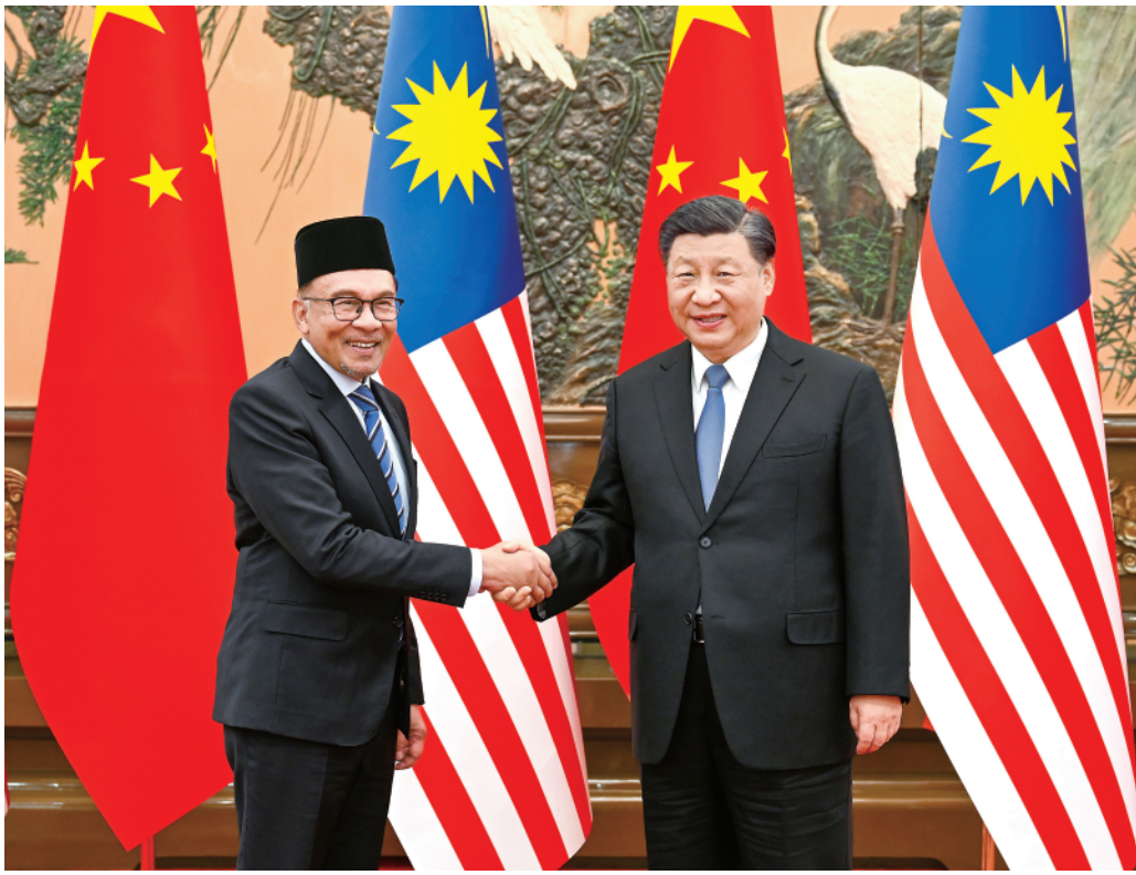
▲3月31日下午，国家主席习近平在北京人民大会堂会见来华进行正式访问的马来西亚总理安瓦尔。