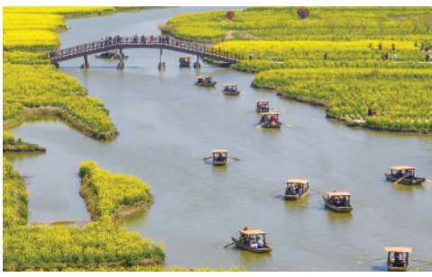
3月31日，游客在江苏兴化千垛景区乘船游览。春日里，人们踏青赏花，享受美好春光。