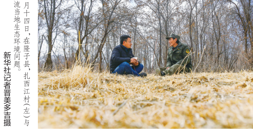
拉西江村在脱贫攻坚战中,形成了特有的服饰、语言文化载体。