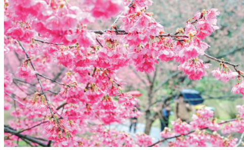
连日来,位于福建省福清市的灵石山国家森林公园内的樱花竞相绽放,吸引游客前来赏樱休闲。

今日4版 总第11000期 / 国内统一连续出版物号CN 11-0209 邮发代号1-19 / 新华网:news.cn 新华每日电视网:mr dx.cn