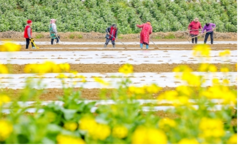
2月9日,农户在四川省射洪市沱牌镇的地里盖膜。早春时节,各地农民抢抓农时,田间一派忙碌景象。