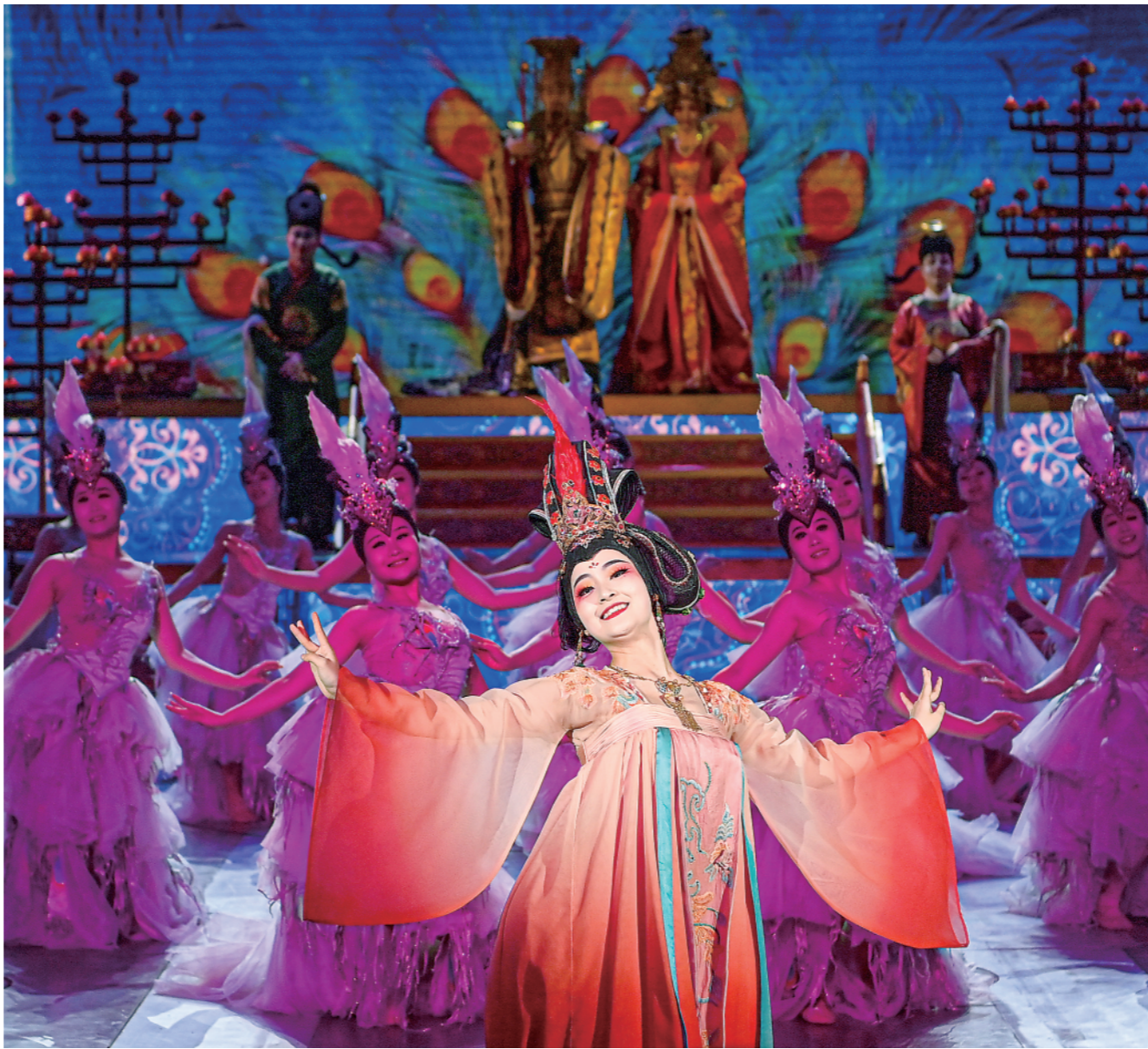
▲西安大唐芙蓉园内上演的大型歌舞剧《梦回大唐》(1月24日摄)。