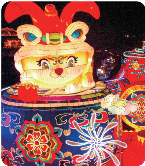
▲1月26日拍摄的西安城墙的花灯。