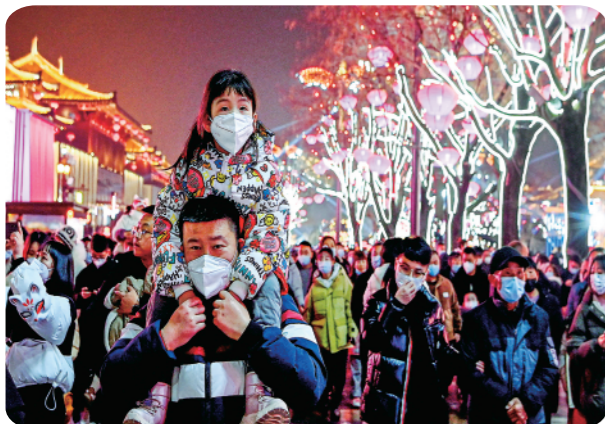
▲人们在大唐不夜城步行街区游玩(1月22日摄)。