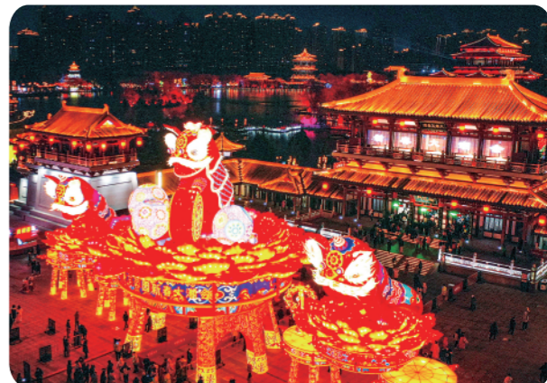
▲1月24日拍摄的大唐芙蓉园内的花灯。