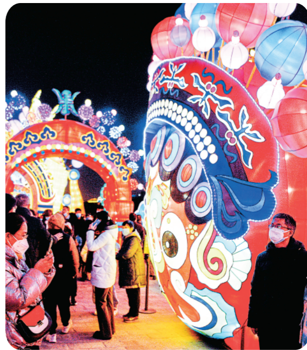
▲人们在西安城墙新春灯会赏灯游玩(1月20日摄)。