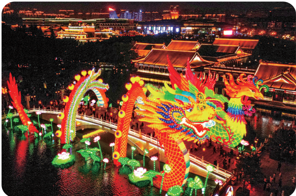
▲1月24日拍摄的大唐芙蓉园内的花灯。