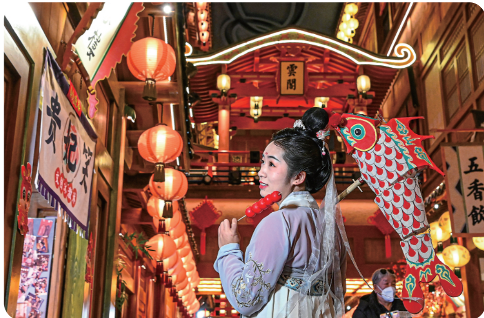
▲游客身着汉服在西安“长安十二时辰”沉浸式唐风市井生活街区内存影(1月24日摄)。