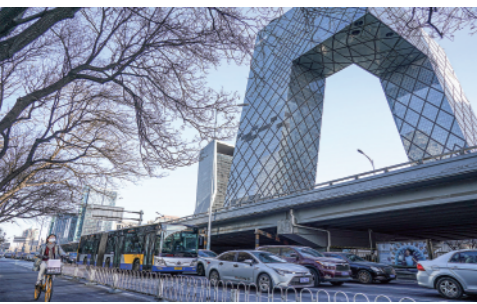
1月28日,车辆在北京东三环辅路行驶。节后首个工作日,人们早早出门,开启一年的工作。