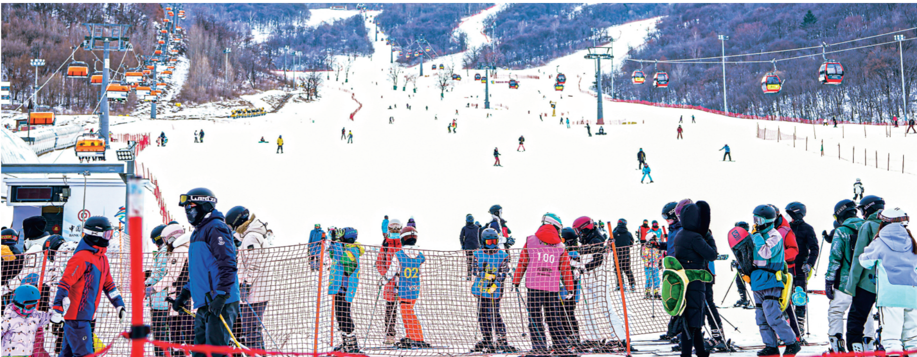
游客在吉林市万科松花湖度假区滑雪(一月二十四日摄)。

新华社长春1月28日电(记者王帆、颜麟、张博宇)“雪场周边民宿预订量同比2019年增幅超16倍”“长白山位居春节热门目的地榜首”“省外游客消费占比68.85%”……春节黄金周后,最新统计数据 displays,吉林省文旅消费稳步复苏,冰雪经济增长势头“兔”飞猛进。