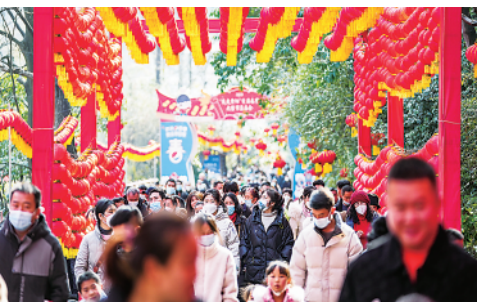
1月25日，市民在贵州省贵阳市云岩区黔灵山公园逛庙会，红红火火过大年。