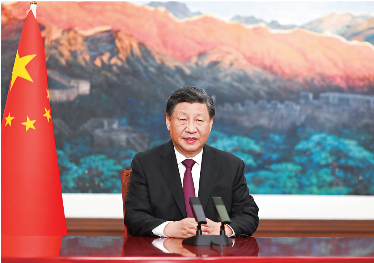
▲1月24日，拉美和加勒比国家共同体第七届峰会在阿根廷首都布宜诺斯艾利斯举行。应拉共体轮值主席国阿根廷总统费尔南德斯邀请，国家主席习近平向峰会作视频致辞。 ▼1月24日，拉美和加勒比国家共同体第七届峰会在阿根廷首都布宜诺斯艾利斯举行。应拉共体轮值主席国阿根廷总统费尔南德斯邀请，国家主席习近平向峰会作视频致辞。

习近平强调，当前，世界进入新的动荡变革期，只有加强团结合作才能共迎挑战、共克时艰。中方愿同拉美和加勒比国家继续守望相助、携手共进，弘扬和平、发展、公平、正义、民主、自由的全人类共同价值，促进世界和平与发展，推动构建人类命运共同体，共同开创更加美好的未来。