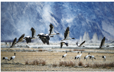
在西藏雅鲁藏布江中游河谷黑颈鹤国家级自然保护区日喀则片区拉孜县附近，大量越冬的黑颈鹤翩翩起舞。

今日 4 版 总第 10984 期 / 国内统一连续出版物号 CN 11-0209 邮发代号 1-19 / 新华网: news.cn 新华每日电视网: mrdx.cn