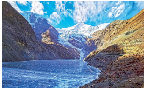
岗布错位于西藏山南浪卡子县岗布沟内，冬季湖面冰层厚达数米，平滑如镜，表面呈蓝色，晶莹剔透。

新华通讯社主管主办 2023年1月5日 星期四 壬寅年十二月十四 新华通讯社出版