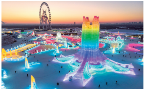
冬日夕阳下，第24届哈尔滨冰雪大世界园区流光溢彩，梦幻壮观，游客在园区内畅享冰情雪趣。