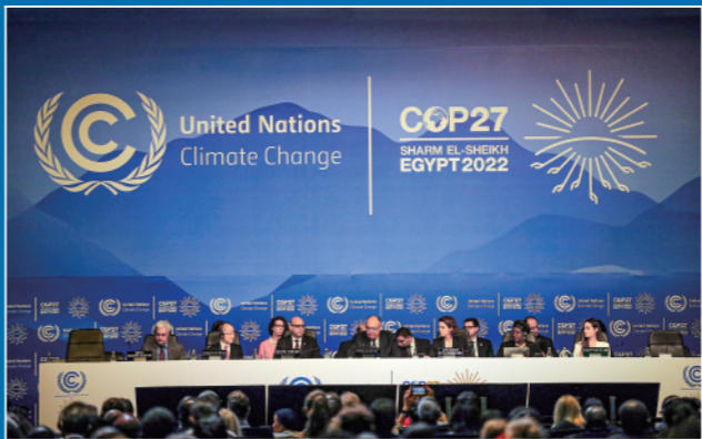
▼这是2022年11月6日,《联合国气候变化框架公约》第二十七次缔约方大会(COP27)在埃及海滨城市沙姆沙伊赫开幕。