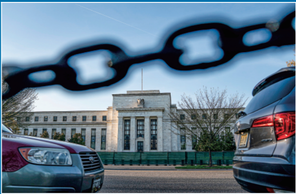
▲这是2022年4月20日在美国华盛顿拍摄的美联储大楼。