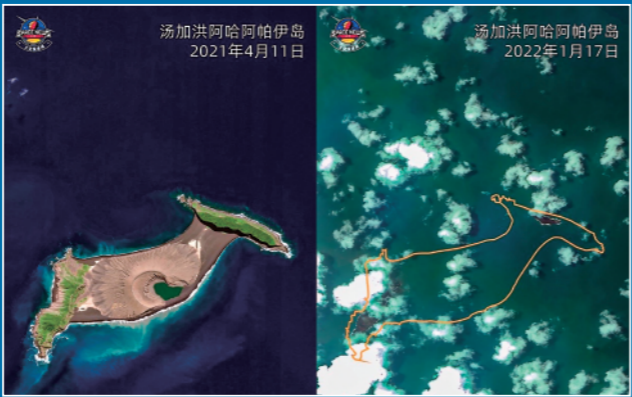
▲2021年4月11日卫星拍摄的汤加洪阿哈阿帕伊岛卫星图片(左)和2022年1月17日卫星拍摄的该岛火山喷发后的卫星图片(拼版照片)。