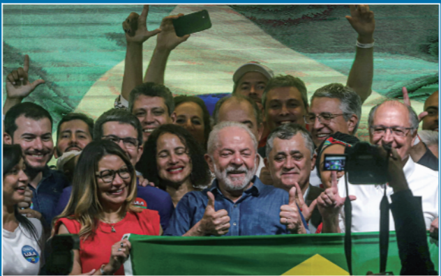
▼这是2022年10月30日,卢拉(前中)在巴西圣保罗参加庆祝活动。