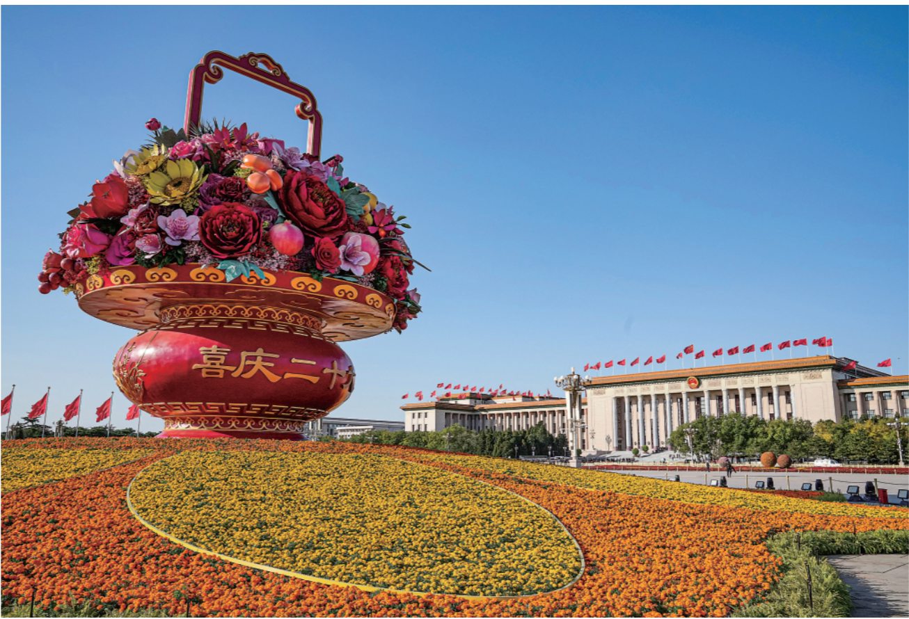
▲这是2022年10月16日在天安门广场拍摄的“祝福祖国”巨型花果篮。中国共产党第二十次全国代表大会于10月16日至22日在北京举行。