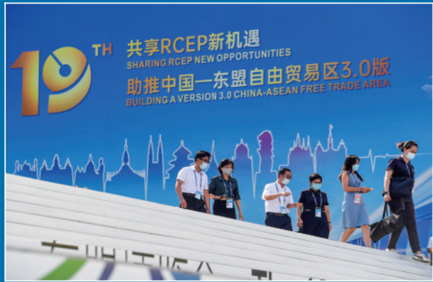
▲2022年9月16日,第十九届中国—东盟博览会和中国—东盟商务与投资峰会在广西南宁国际会展中心开幕。

12月10日,习近平主席在结束出席中国—阿拉伯国家峰会、中国—海湾阿拉伯国家合作委员会峰会并对沙特进行国事访问后回国。这一年,习近平主席开启“冬奥时间”,世界目光聚焦东方。习近平主席还3次出访,到访5国,主持或出席中国—中亚、中阿、中海、金砖、上合组织、G20峰会和APEC领导人非正式会议等多边会议,同俄罗斯总统普京、美国总统拜登、法国总统马克龙、德国总理朔尔茨、欧洲理事会主席米歇尔和联合国秘书长古特雷斯等多国领导人和国际组织负责人举行会晤。中国元首外交高举和平、发展、合作、共赢旗帜,大力推动全球发展倡议、全球安全倡议取得成果,为维护世界和平、促进共同发展凝聚广泛共识、汇聚磅礴力量。 新华社北京12月30日电