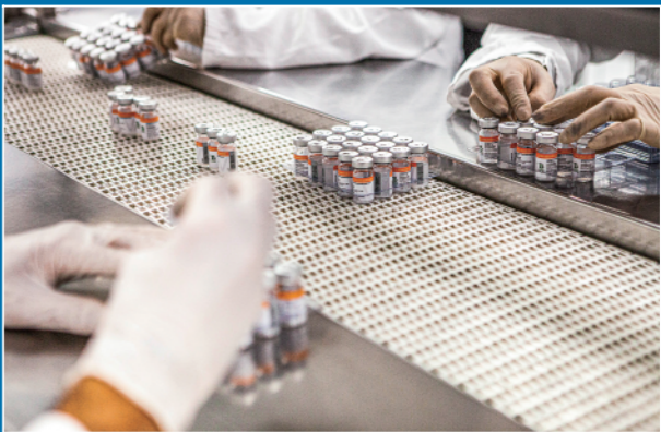
▼这是2022年8月31日,工作人员在巴西圣保罗布坦坦研究所的新冠疫苗生产线上工作。自2020年6月以来,巴西布坦坦研究所与中国科兴公司开展了多项临床研究。