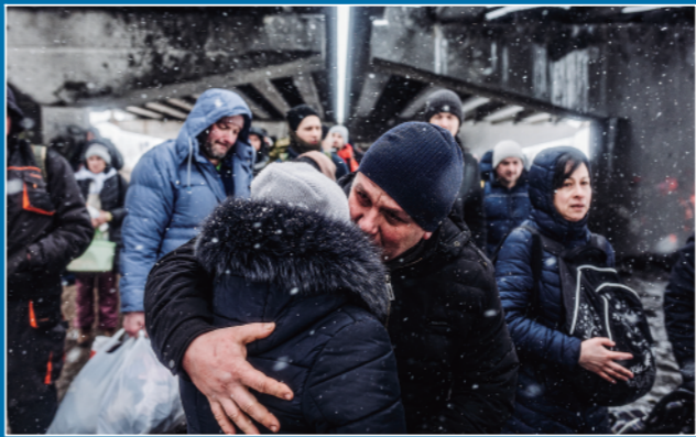
▲这是2022年3月8日,一对情侣在乌克兰伊尔平告别。俄方3月9日在乌克兰多个城市实行“安静模式”并开放人道主义通道。