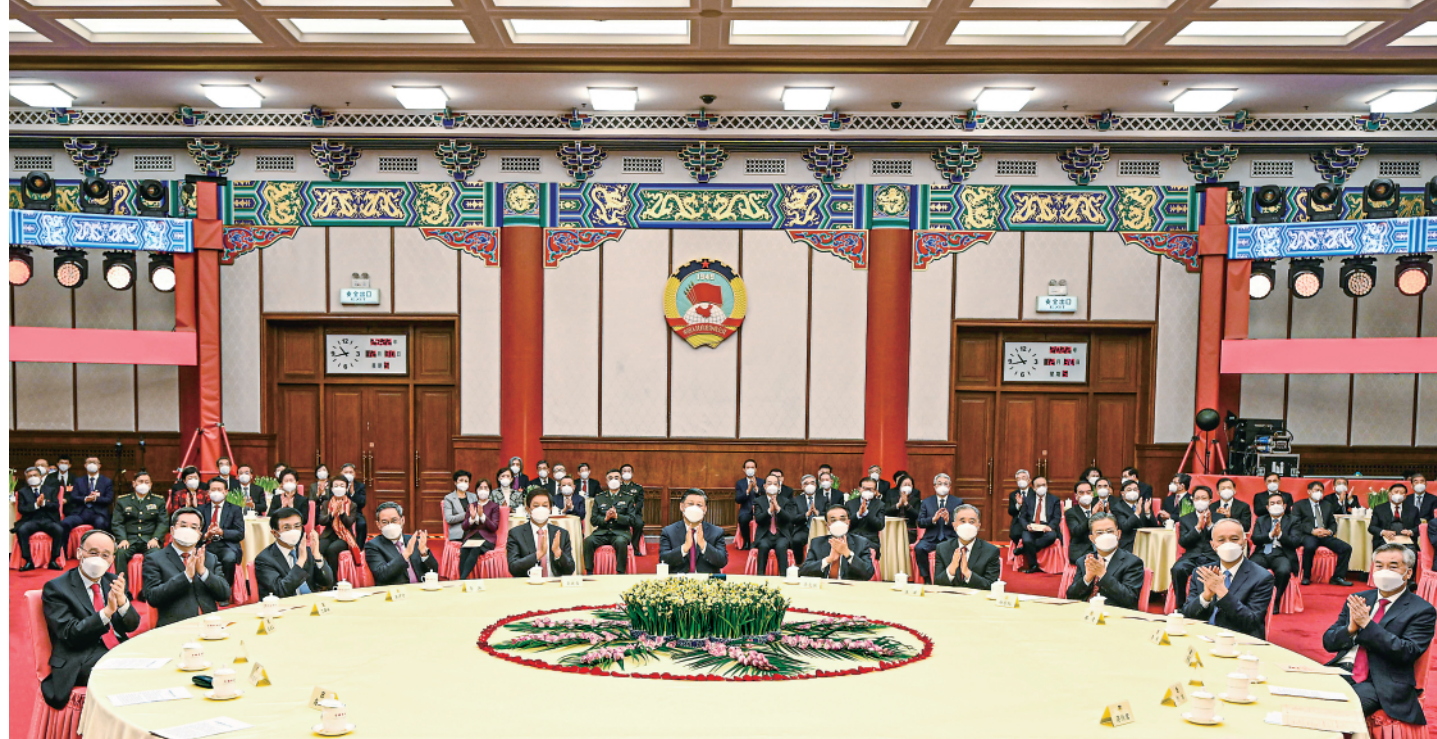
◀ 12月30日，全国政协在北京举行新年茶话会。中共中央总书记、国家主席、中央军委主席习近平在茶话会上发表重要讲话。

描绘了全面建设社会主义现代化国家的宏伟蓝图。我们坚持稳中求进工作总基调，全面贯彻新发展理念，推动高质量发展，经济保持增长，粮食喜获丰收，保持就业、物价稳定。我们因时因势优化防控策略，最大程度守护人民生命安全和身体健康，最大限度减少疫情对经济社会发展影响。我们成功举办北京冬奥会、冬残奥会。我们隆重庆祝香港回归祖国25周年。我们对“台独”分裂行径和外部势力干涉进行坚决斗争。我们继续推进中国特色大国外交，维护外部环境总体稳定。这些成绩