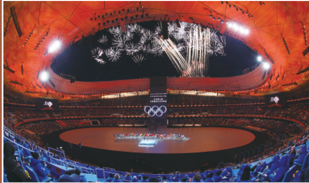
▲2月4日晚,北京冬奥会开幕式在国家体育场举行。这是开幕式上的焰火表演。