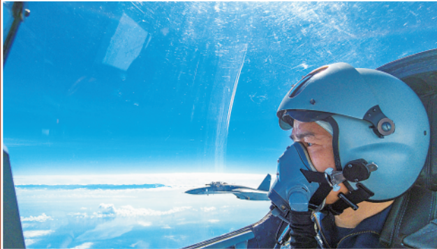
▲8月7日,中国人民解放军东部战区按计划,继续在台岛周边海空域进行实战化联合演训。这是战机正在进行编队飞行。