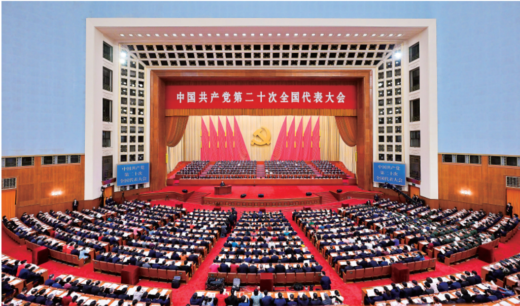
▲2022年10月16日,中国共产党第二十次全国代表大会在北京人民大会堂开幕。习近平代表第十九届中央委员会向大会作报告。