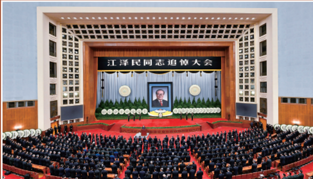
▼12月6日,中共中央、全国人大常委会、国务院、全国政协、中央军委在北京人民大会堂隆重举行江泽民同志追悼大会。