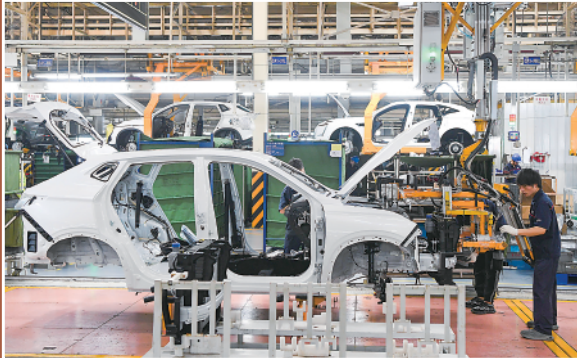
▲6月16日拍摄的重庆长安汽车股份有限公司智能化工厂作业现场。