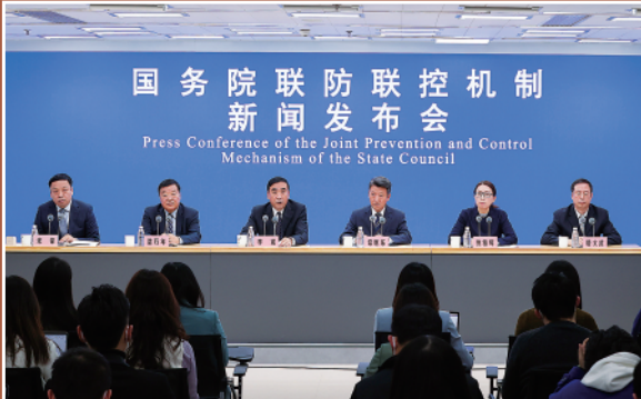
▼12月27日拍摄的国务院联防联控机制新闻发布会现场。