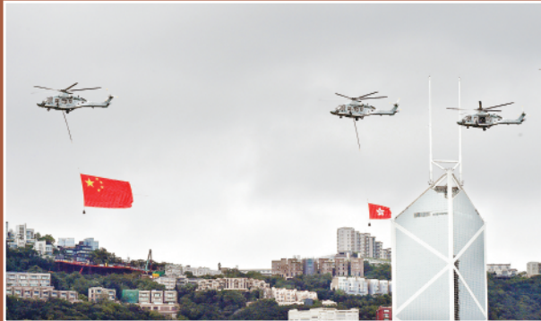
▼7月1日,香港特区政府举行升旗仪式,庆祝香港回归祖国25周年。这是分别悬挂国旗、区旗的直升机从空中飞过。