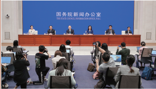
▲4月25日,国新办举行《关于推动个人养老金发展的意见》国务院政策例行吹风会。