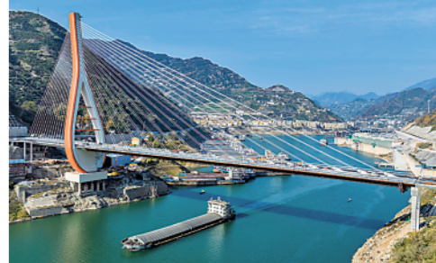
12月17日,工人在香溪河大桥上施工。湖北省宜昌市香溪河上“琵琶形”独塔斜拉桥主体结构基本建成。

今日8版 总第10946期 / 国内统一连续出版物号CN 11-0209 邮发代号1-19 / 新华网:news.cn 新华每日电视网:mr dx.cn