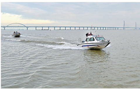
近日,江苏南通市通州区公安部门联合渔政部门,加强水上巡查,严查非法捕捞等行为,持续深入做好长江禁捕工作。

今日 8 版 总第 10943 期 / 国内统一连续出版物号 CN 11-0209 邮发代号 1-19 / 新华网:news.cn 新华每日电讯网:mr dx.cn