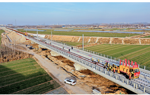
12月15日,济(南)郑(州)高铁(山东段)铺轨开工仪式在聊城举行。