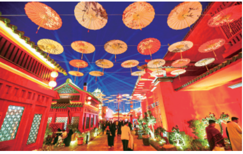
这是12月5日在沙特阿拉伯首都利雅得拍摄的世界大道“中国城”。