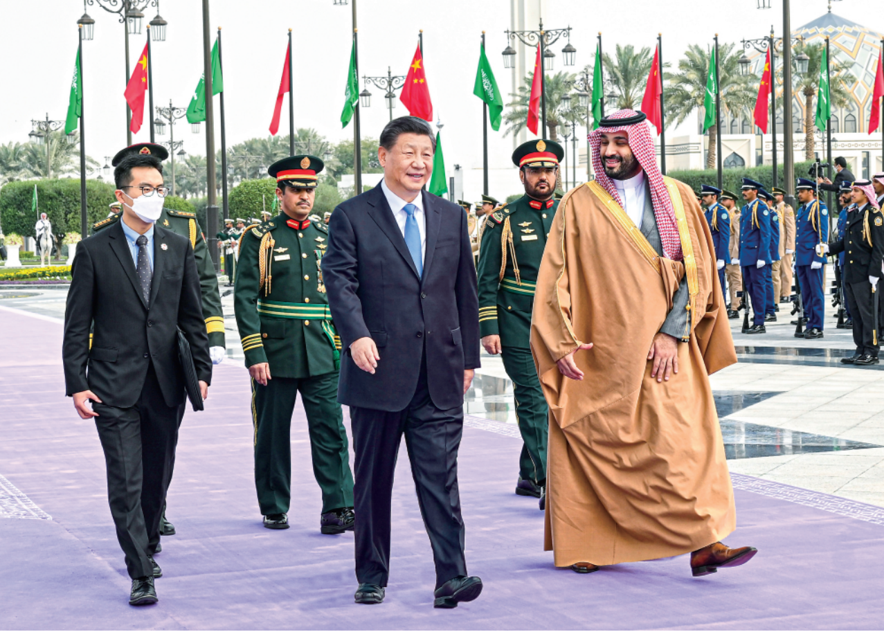
▲当地时间12月8日中午,沙特王储兼首相穆罕默德代表国王萨勒曼为正在沙特进行国事访问的国家主席习近平在利雅得王宫举行欢迎仪式。