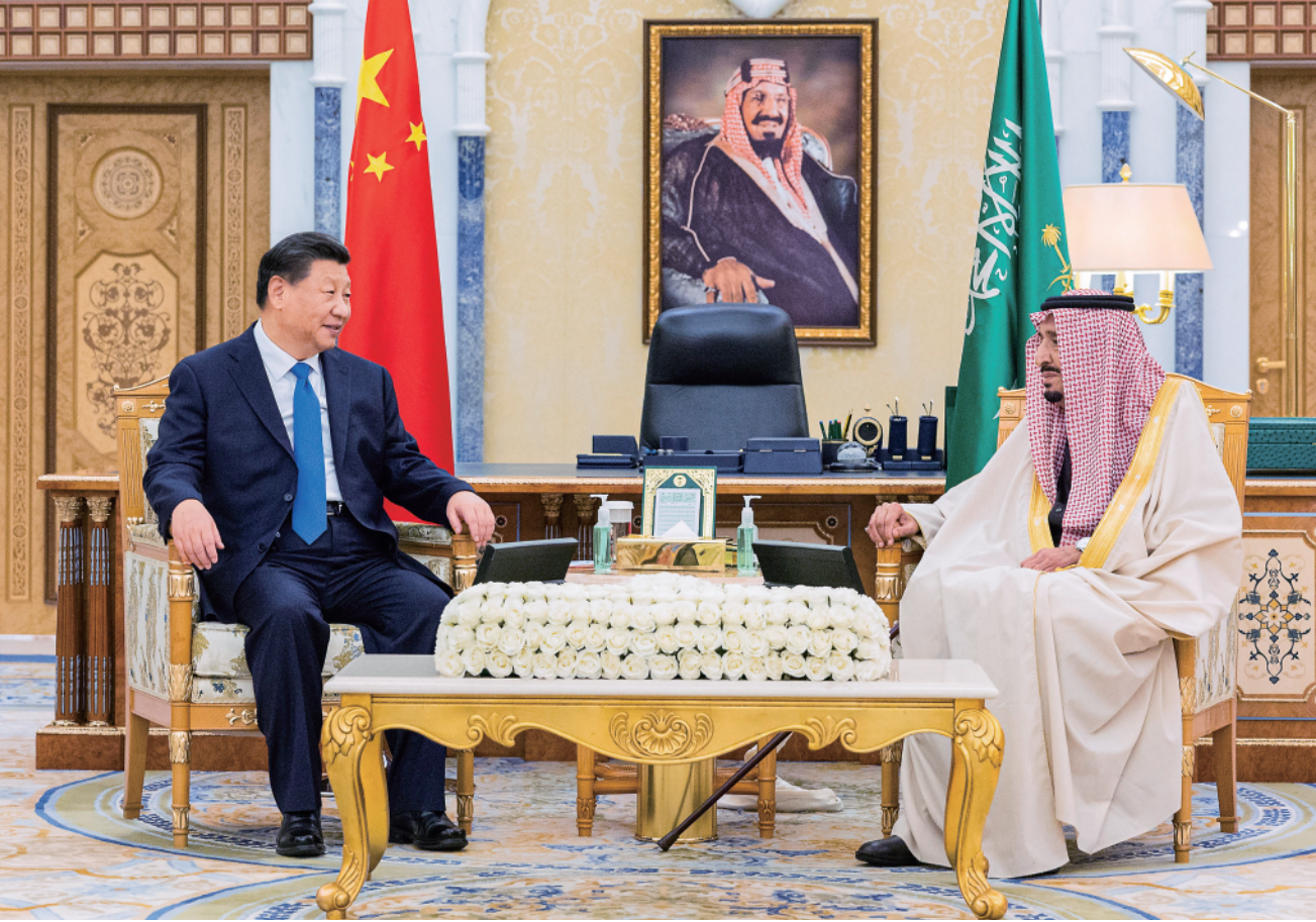
▲当地时间12月8日下午,国家主席习近平在利雅得王宫会见沙特国王萨勒曼。