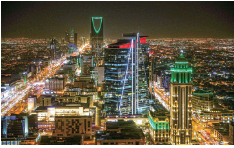
这是12月4日拍摄的沙特阿拉伯首都利雅得城市夜景。

今日 8 版 总第 10936 期 / 国内统一连续出版物号 CN 11-0209 邮发代号 1-19 / 新华网: news.cn 新华每日电视网: mrdx.cn