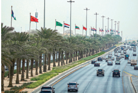
12 月 7 日，多国国旗飘扬在沙特阿拉伯首都利雅得街头。