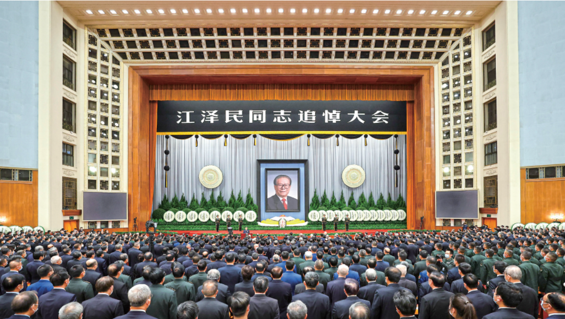
▲12月6日,中共中央、全国人大常委会、国务院、全国政协、中央军委在北京人民大会堂隆重举行江泽民同志追悼大会。