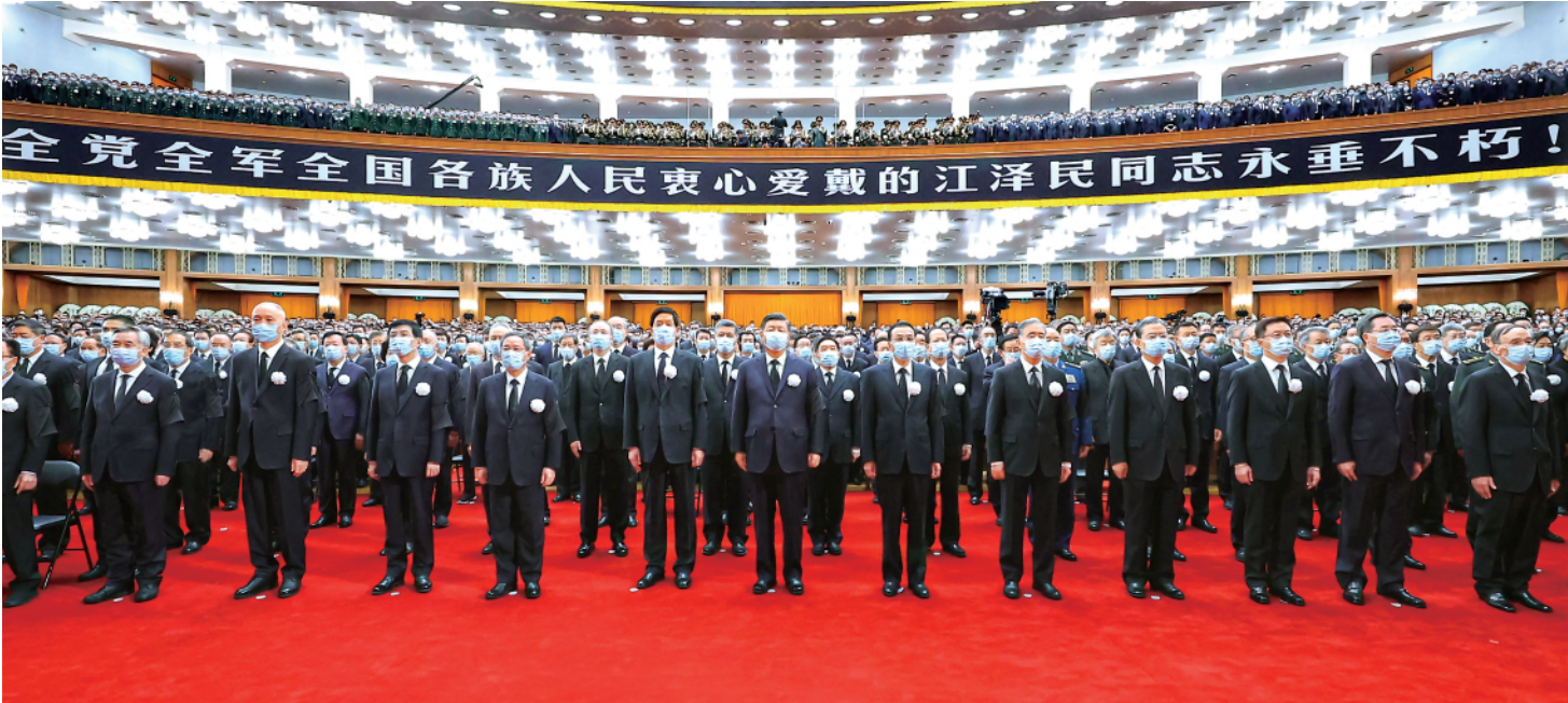
▲12月6日,中共中央、全国人大常委会、国务院、全国政协、中央军委在北京人民大会堂隆重举行江泽民同志追悼大会。习近平、李克强、栗战书、汪洋、李强、赵乐际、王沪宁、韩正、蔡奇、丁薛祥、李希、王岐山等参加大会。