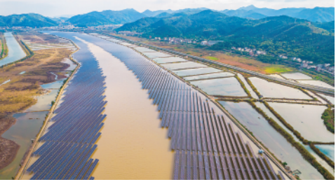
浙江温岭潮光互补型智能光伏电站(11月23日摄),开创了光伏与潮汐协调发电的新能源综合运用新模式,形成“日月同辉齐发力、水上水下齐发电”的场景。