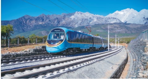
11月28日,丽江观光火车一期工程正式进入通车试运行阶段。丽江观光火车是连接世界文化遗产丽江古城与玉龙雪山5A级景区的旅游观光专线