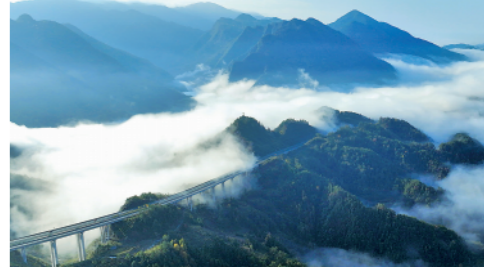
11月25日,湖北宣(恩)鹤(峰)高速公路鹤峰段在云雾中若隐若现,美如画卷。

新华通讯社主管主办 2022年11月26日 星期六 壬寅年十一月初三 新华通讯社出版