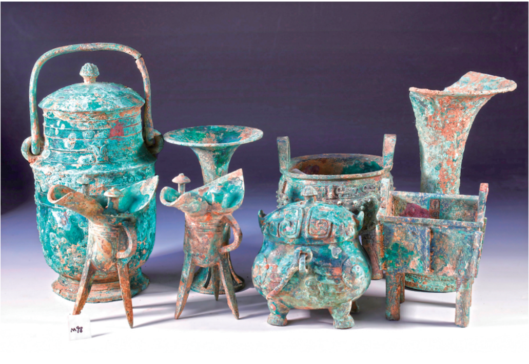
▲殷墟外围区域邵家棚遗址墓葬出土的铜礼器组合。

土的甲骨文为我们保存3000年前的文字，把中国信史向上推进了约1000年。”“中国的汉文字非常了不起，中华民族的形成和发展离不开汉文字的维系。” 11月16日，中国文字博物馆续建工程和汉字公园正式面向公众开放。这座以文字为主题的国家级博物馆，系统展陈了中国文字的构形特征和演化历程，尽显中国文字文化之美。 行走在安阳的大街小巷，随处可见的甲骨文元素，也时刻昭示着这座城市与甲骨文的不解之缘。 《尚书》有云：惟殷先人，有册有典。文字，是文明产生的重要标志，也是文明传承的重要载体。 十九世纪七八十年代，小屯村的村民们发现了许多带有刻痕的龟甲、兽骨，便将其称