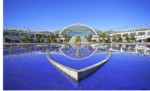
11月19日,第6届中国—南亚博览会暨第26届中国昆明进出口商品交易会在云南昆明开幕。

新华通讯社主管主办 2022年11月20日 星期日 壬寅年十月廿七 新华通讯社出版