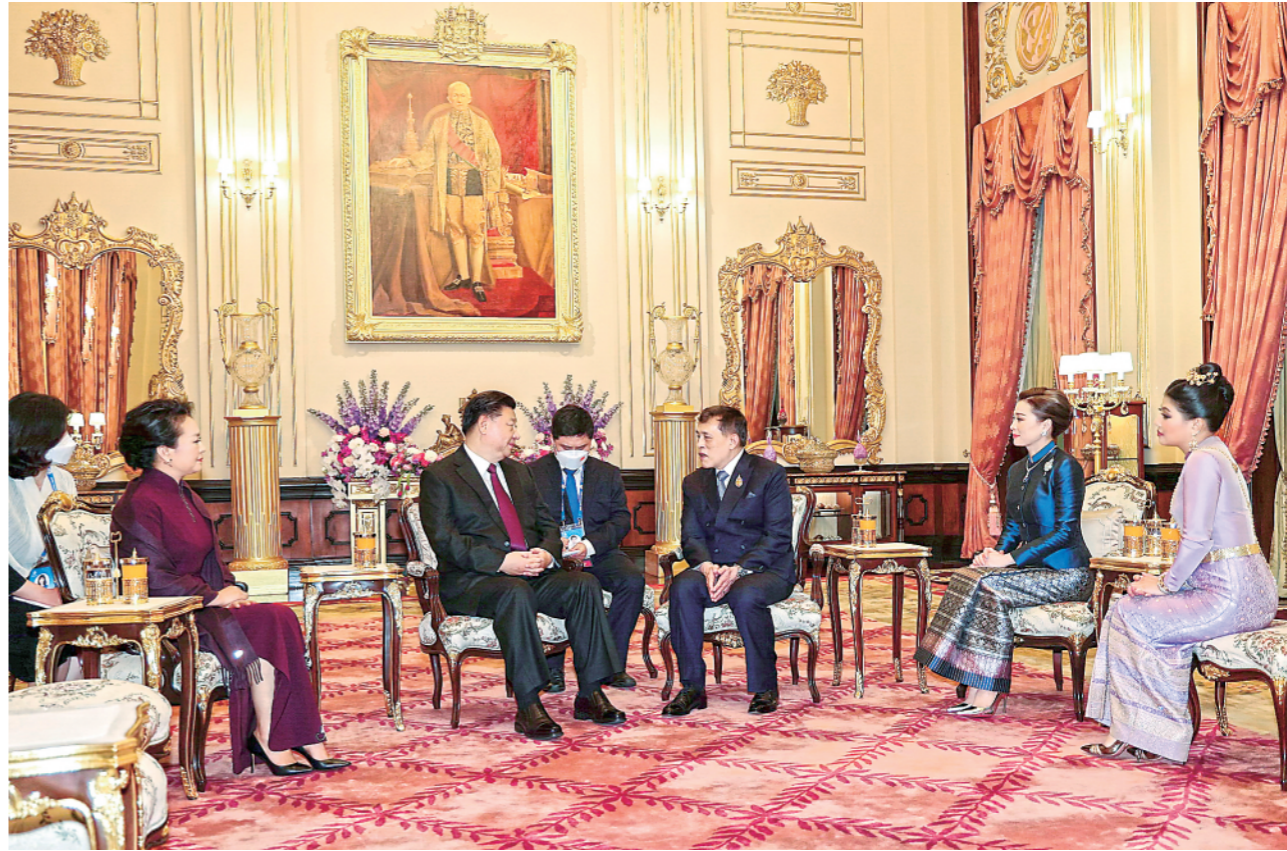
▲当地时间11月18日晚,国家主席习近平和夫人彭丽媛在曼谷大王宫会见泰国国王哇集拉隆功和王后素提达。

新华社曼谷11月19日电(记者刘华、耿学鹏)当地时间11月19日上午,国家主席习近平在曼谷继续出席亚太经合组织第二十九次领导人非正式会议。