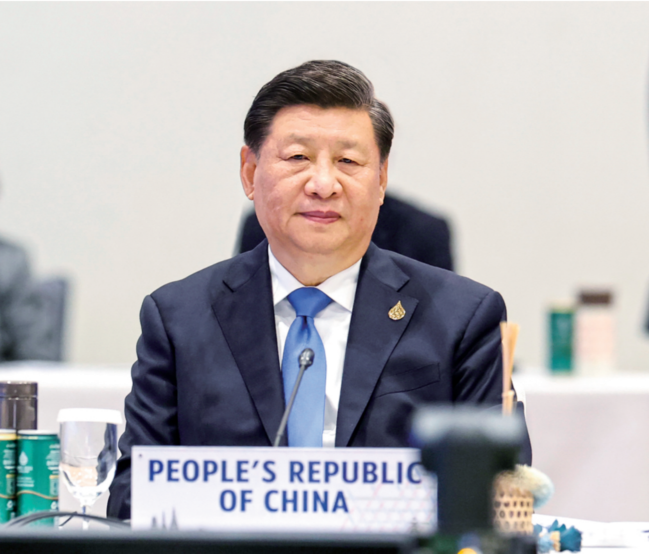
▲当地时间11月19日上午,国家主席习近平在泰国曼谷继续出席亚太经合组织第二十九次领导人非正式会议。