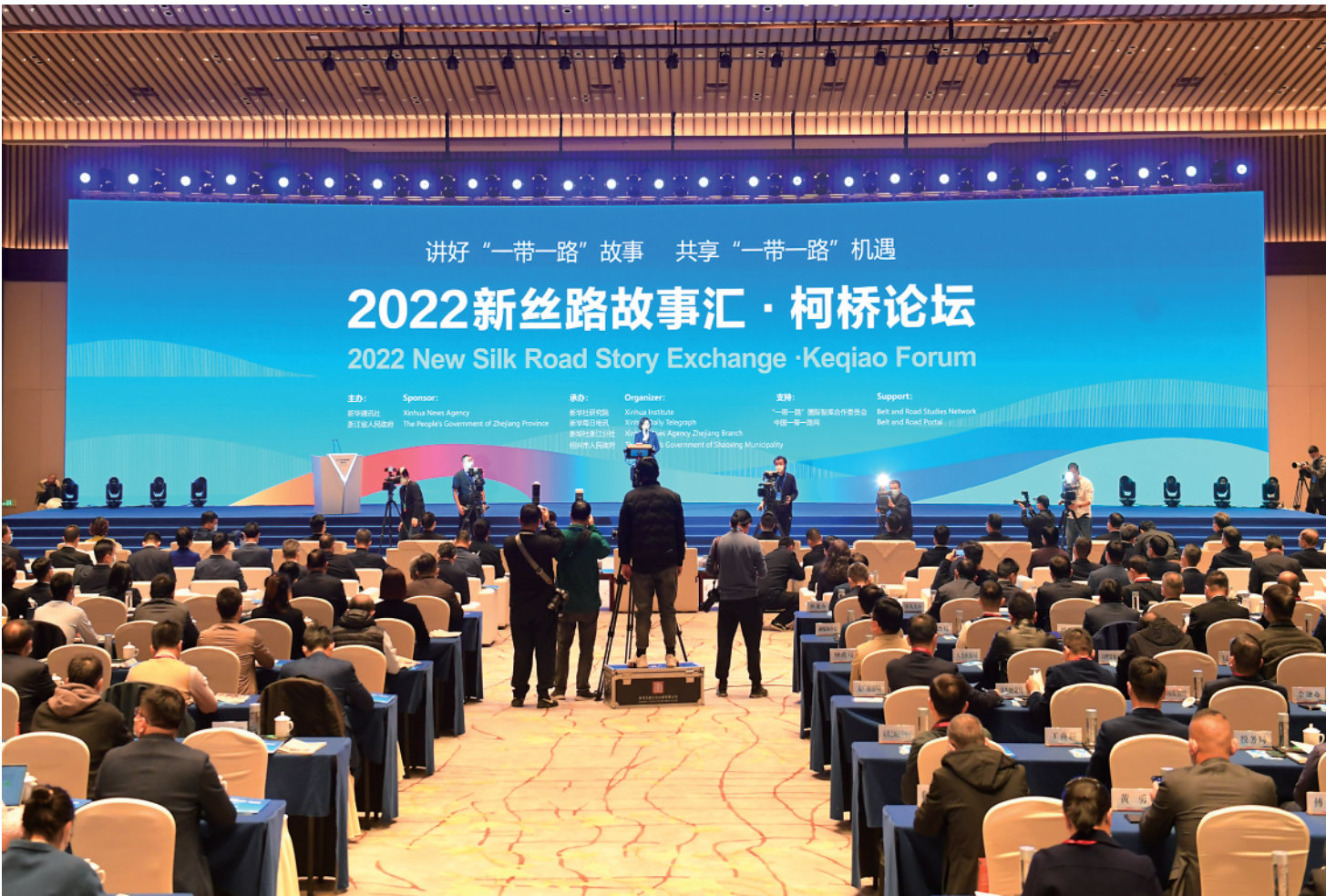
▲11月15日,2022新丝路故事汇·柯桥论坛在浙江省绍兴市柯桥区开幕。

本次论坛由新华通讯社、浙江省人民政府主办。论坛同时启动了“新丝路故事汇”全球精彩案例征集活动。