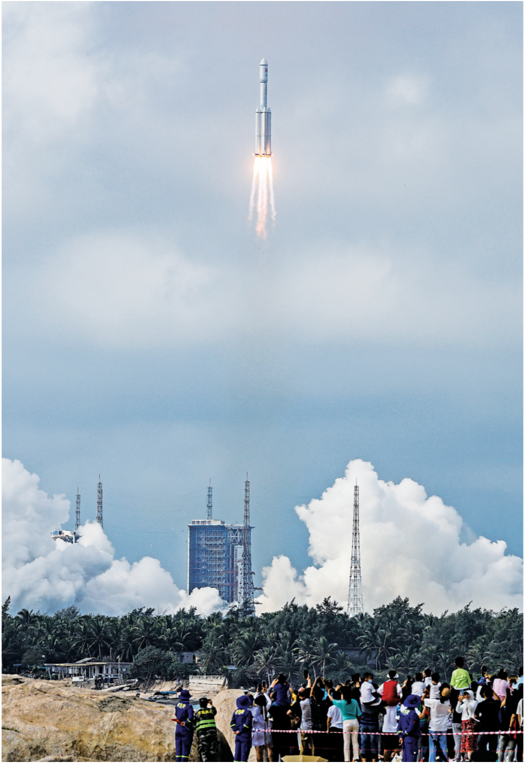
▲11月12日10时03分，搭载着天舟五号货运飞船的长征七号遥六运载火箭在我国文昌航天发射场准时点火发射，约10分钟后，船箭成功分离并进入预定轨道，飞船太阳能帆板顺利展开工作，发射取得圆满成功。