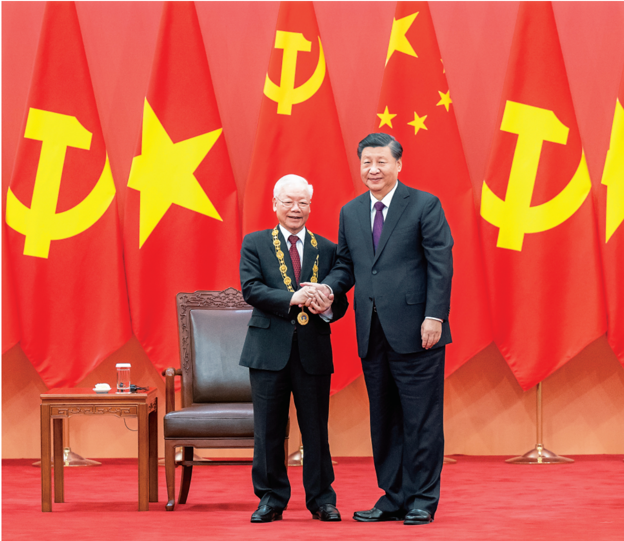
▼10月31日，中共中央总书记、国家主席习近平在北京人民大会堂同越共中央总书记阮富仲举行会谈。这是会谈前，习近平在人民大会堂北大厅为阮富仲举行欢迎仪式。