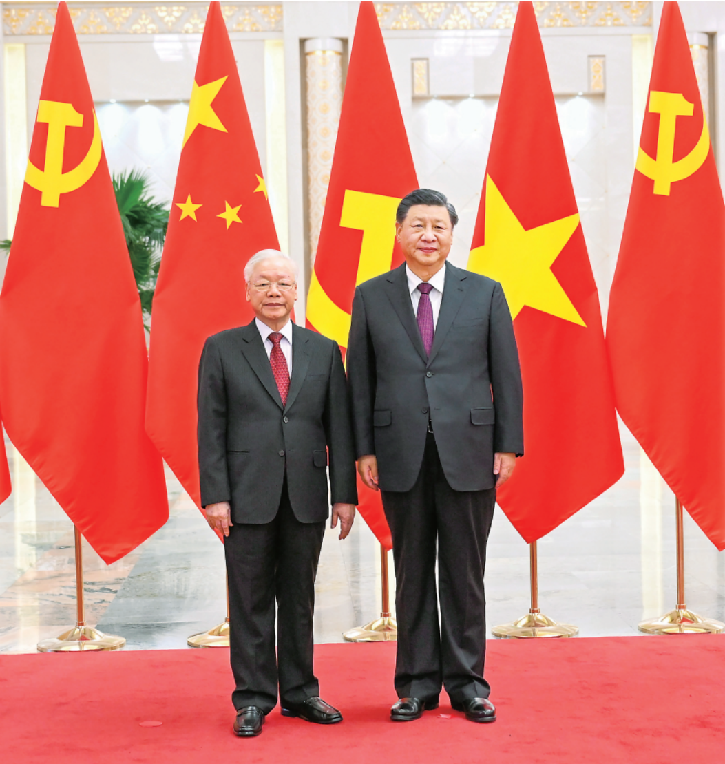
▲10月31日，中共中央总书记、国家主席习近平在北京人民大会堂同越共中央总书记阮富仲举行会谈。这是会谈前，习近平在人民大会堂北大厅为阮富仲举行欢迎仪式。