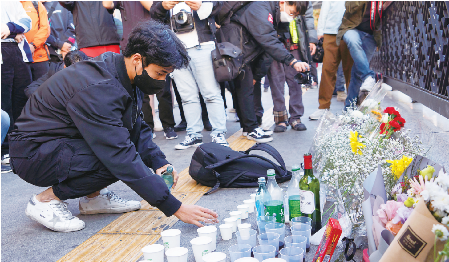
十月三十日,民众在韩国首尔市龙山区梨泰院洞一带悼念踩踏事故遇难者。