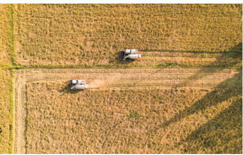
在湖南省常德市安乡县三岔河镇,农民驾驶农机收割晚稻。近日,部分地区水稻开镰收割。