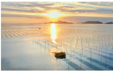
金秋十月,福建省宁德市霞浦县6.5万亩海上养殖紫菜迎来收获时节,海上一片秋收画卷。