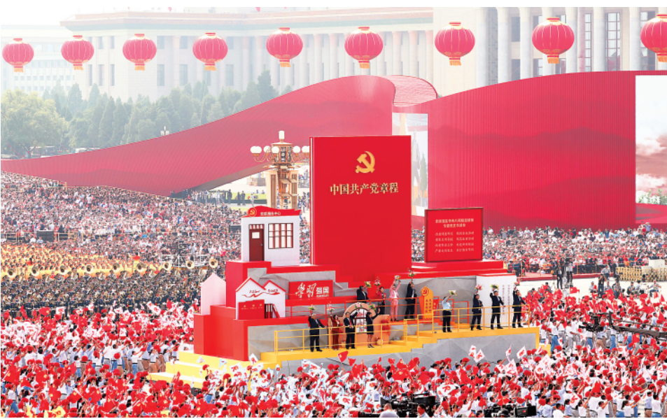
▲2019年10月1日上午,庆祝中华人民共和国成立70周年大会在北京天安门广场隆重举行。这是群众游行中的“从严治党”方阵。

新时代十年创造的伟大成就、实现的伟大变革,最根本的原因在于有习近平总书记作为党中央的核心、全党的核心掌舵领航,在于有习近平新时代中国特色社会主义思想科学指引。 二十大代表、中央政策研究室副主任