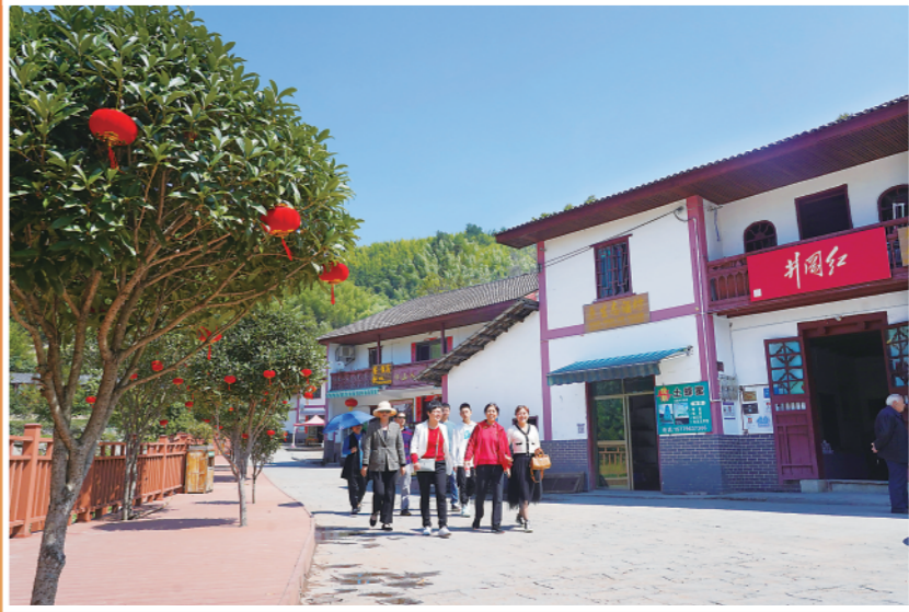
►10月16日，游客在江西井冈山神山村旅游观光。