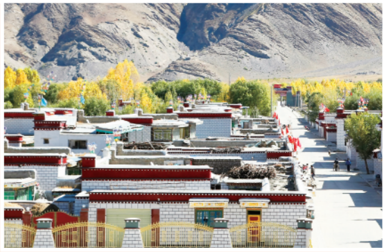
▲这是10月16日拍摄的西藏自治区山南市克松社区。