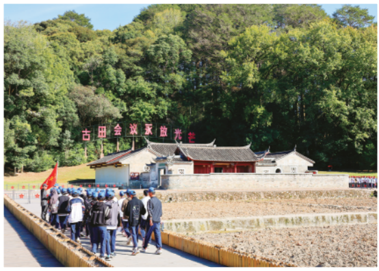
▲10月19日，在福建省上杭县古田镇，中学生研学团队在古田会议会址参观学习。