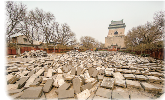
▲ 上图为2022年9月18日,市民在北京钟鼓楼广场上休闲健身。钟鼓楼区域经整治后成为了市民文化生活的重要场所;下图为2014年3月25日,北京钟鼓楼广场地面进行大修。