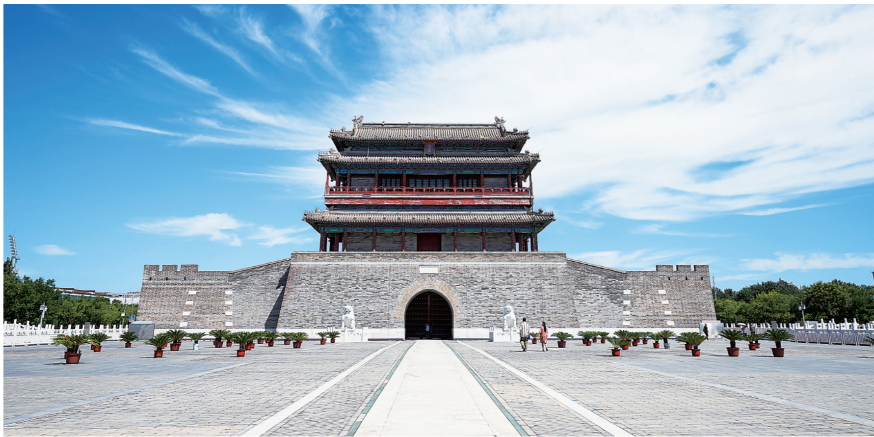
▲ 2022年8月16日,游客在位于北京中轴线上的永定门城楼前参观游览。