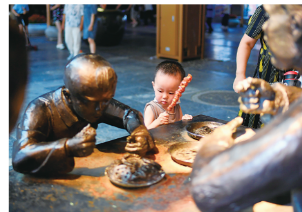
▲ 2022年7月16日,小朋友在北京市前门商业区游玩。