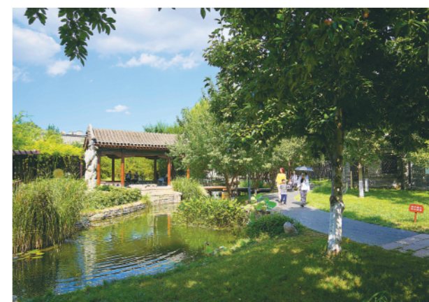
▼ 2022年8月16日,人们在北京市东城区三里河参观游览。曾经杂院林立的草厂三里河,如今小桥、流水、廊亭、人家,颇有水乡意境。