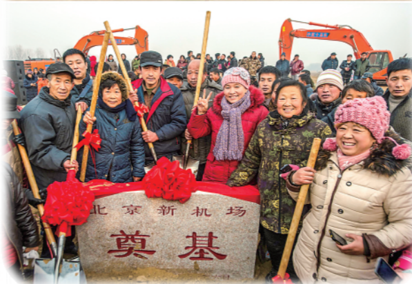
▲ 上图为2022年9月7日,一架中国南方航空公司的飞机从北京大兴国际机场起飞;下图为2014年12月26日,来自附近村庄的村民在北京新机场奠基石旁留念。