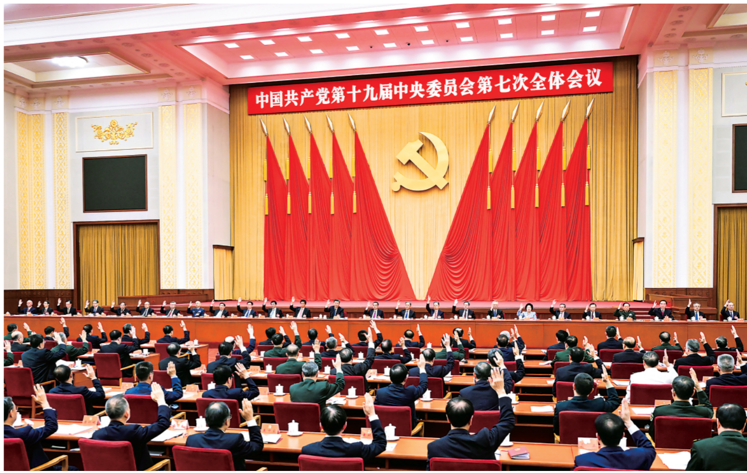
▲中国共产党第十九届中央委员会第七次全体会议,于2022年10月9日至12日在北京举行。中央政治局主持会议。