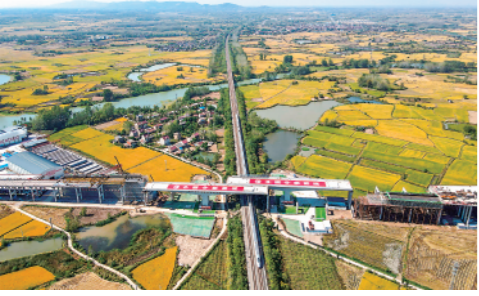
10月12日,明(光)巢(湖)高速上跨沪蓉铁路万吨双幅转体桥转体成功,为明巢高速按期通车提供了保障。