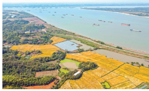
金秋时节,在长江沿岸的安徽省芜湖市繁昌区,大片水稻田陆续迎来丰收(10月11日摄)。

新华通讯社主管主办 2022年10月13日 星期四 壬寅年九月十八 新华通讯社出版