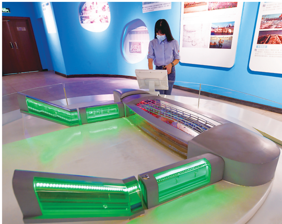
▲9月27日,游客在重庆白鹤梁水下博物馆地面陈列馆参观。