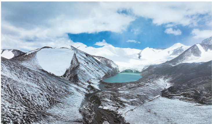
▶7月21日在青海长江源地区拍摄的冰川与湖泊。