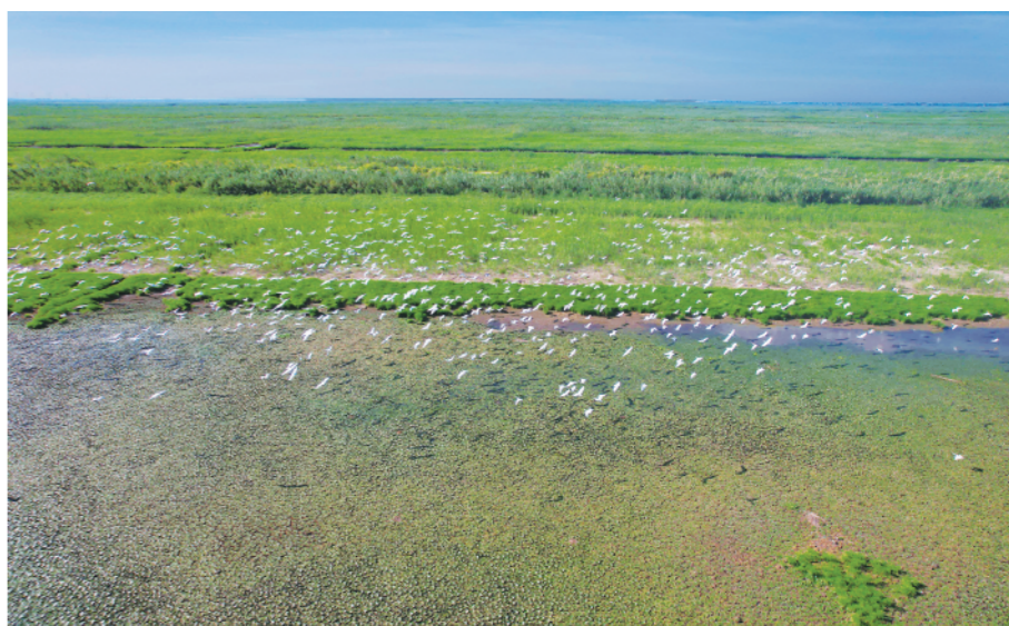
▲8月18日拍摄的湖南省沅江市南洞庭湖风光。