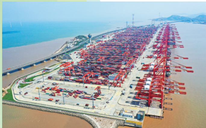
◀9月23日拍摄的上海洋山港集装箱码头。