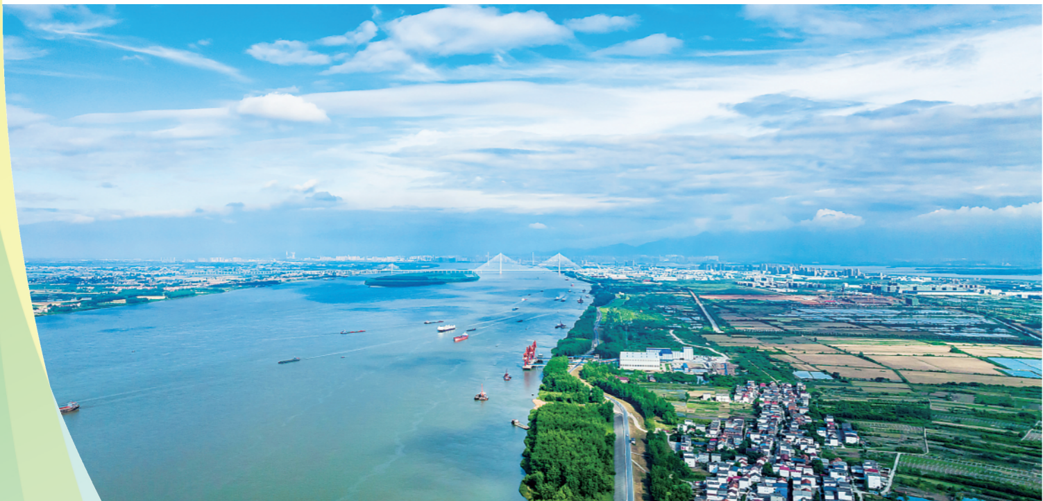
▲长江九江柴桑段(无人机照片,5月23日摄)。