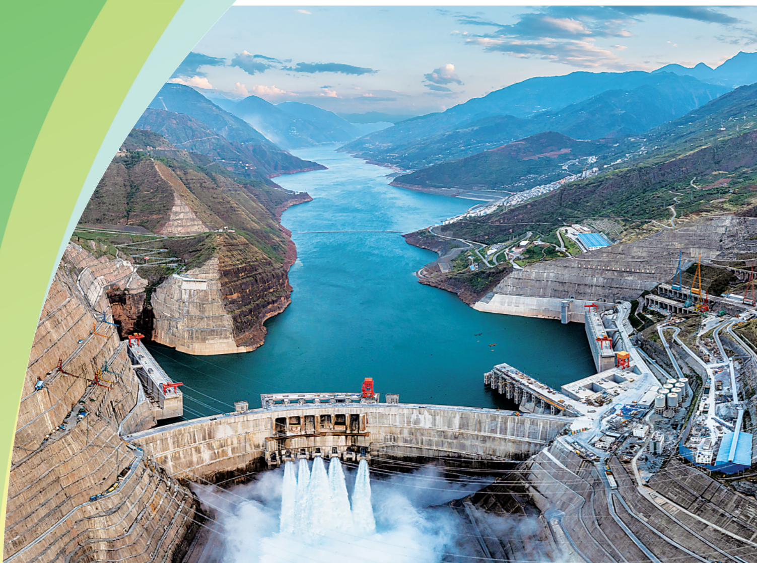
▲5月29日拍摄的白鹤滩水电站一景。