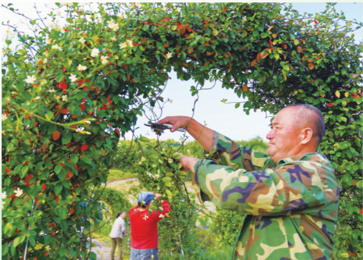
▶9月28日,在四川泸州纳溪区大渡口镇,工人在长江支流清溪河岸岸边绿地修剪植物。