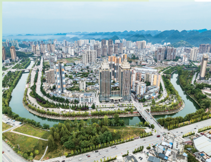
◀长江支流清江穿过湖北省利川市主城区(9月30日摄)。