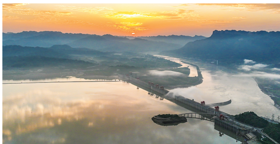
▲长江三峡水利枢纽工程(6月6日摄)。