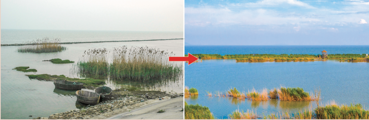
左图为2008年4月7日拍摄的巢湖景象。 右图为2021年7月9日拍摄的位于合肥市包河区的巢湖湖滨湿地风景。