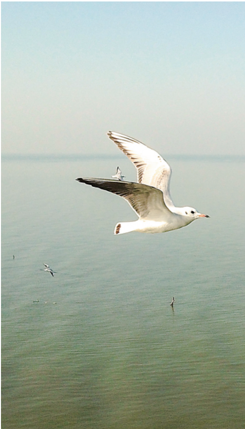
▲这是2019年11月22日拍摄的巢湖,鸟儿飞翔。 ▼这是2021年9月11日拍摄的巢湖风光。

党的十八大以来,巢湖治理谱写新篇章。遵循山水林田湖草沙是生命共同体的理念,以系统治理和生态修复为本,巢湖治理把处理好人与自然的关