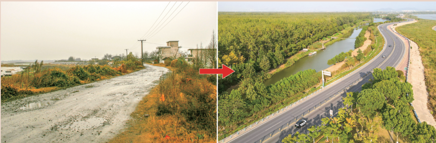
左图为2007年拍摄的巢湖岸线景象(资料照片)。 右图为2022年9月6日拍摄的巢湖岸线景象。