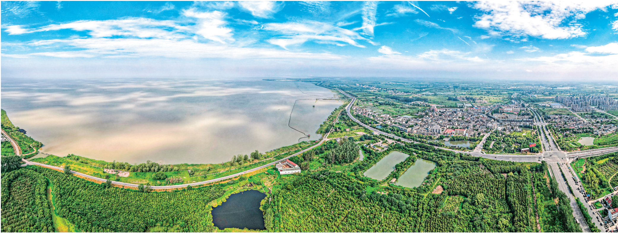
▲这是2021年7月20日拍摄的巢湖风景。