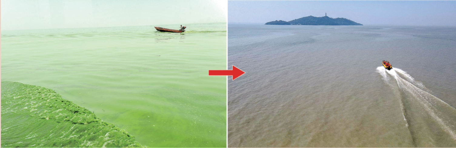
左图为2012年6月9日拍摄的渔船在巢湖湖面航行。 右图为2022年9月6日拍摄的游船在巢湖湖面航行。