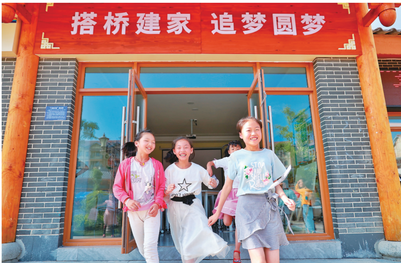
▲小朋友在毕节市七星关区柏杨林易地扶贫搬迁安置点玩耍(2020年8月3日摄)。

智能化机械拉布、裁剪高效运转，从事熨烫、车缝等工序的工人操作娴熟……位于纳雍县的毕节市晶焯制衣有限公司正赶制国际服装品牌订单。