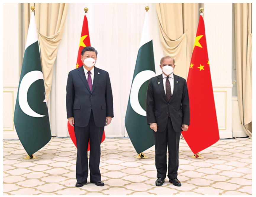
▲当地时间9月16日上午,国家主席习近平在撒马尔罕国宾馆会见巴基斯坦总理夏巴兹。

习近平强调,双方要继续坚定相互支持,深化发展战略对接,发挥好中巴经济走廊联委会作用,确保大项目顺利建设运营。要拓展产业、农业、科技、社会民生等领域合作,为走廊建设增添新动能。希望巴方切实保障在巴中国公民和机构安全,保障企业合法权益。中方赞赏巴方率先积极响应全球发展倡议和全球安全倡议,愿同巴方推动倡议落地生根。(下转3版)