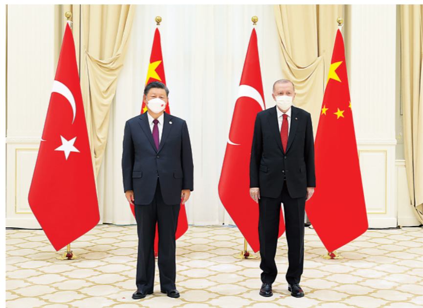
▲当地时间9月16日上午,国家主席习近平在撒马尔罕国宾馆会见土耳其总统埃尔多安。

合作。伊方支持共建“一带一路”倡议、全球发展倡议、全球安全倡议,愿同中方深入合作,坚持真正的多边主义。丁薛祥、杨洁篪、王毅、何立峰等参加会见。