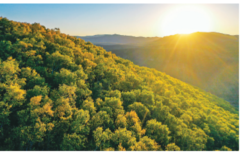
秋日里，内蒙古呼和浩特市大青山色彩斑斓，层林尽染，景色宜人(9月13日摄)。