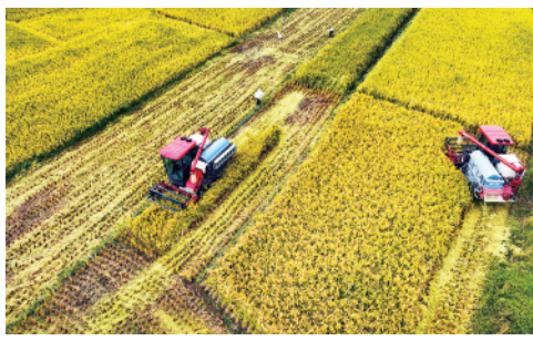
近日，陕西省汉中市洋县17.3万亩水稻喜获丰收，乡村田野处处飘散着稻谷的芳香(9月10日摄)。

今日8版 总第10851期 / 国内统一连续出版物号CN 11-0209 邮发代号1-19 / 新华网:news.cn 新华每日电视网:mr dx.cn