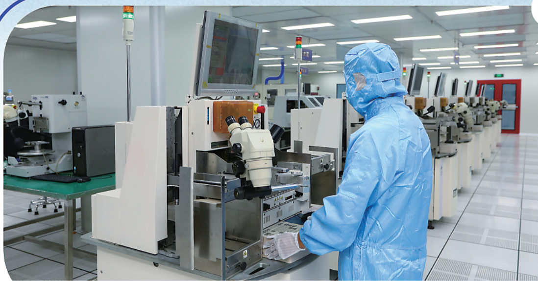
摩尔精英重庆先进封装创新中心焊线工程师在进行芯片焊线程序编程作业

8月22日至24日,由工业和信息化部、国家发展改革委、科技部、国家网信办、中国科学院、中国工程院、中国科协,新加坡贸工部和重庆市人民政府共同举办的2022中国国际智能产业博览会(以下简称“智博会”)在重庆举行。