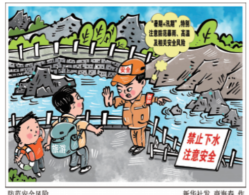
防范安全风险 新华社发 商海春 作

新华社北京8月15日电(记者刘夏村、黄垚、张海磊)暑期是旅游出行的高峰期,也正处我国主汛期,是强降水、高温等高发时段。专家提醒,公众出行要特别注意防范暴雨、高温及相关安全风险。 近期,局地强降雨引发山洪成灾快、危害大。今年入夏以来,我国高温日数多、覆盖范围广、多地最高气温破历史极值。中央气象台15日继续发布高温红色预警,截至15日,中央气象台已连续26天发布高温预警。 高温、强降雨等高影响天气不仅会给生产生活、交通出行等带来不利影响,其引发的次生灾害也不容小觑。如持续强降雨易造成洪涝灾害,还会引发滑坡、泥石流等地质灾害。 中央气象台首席预报员牛若芸建议,公众在出行前需密切关注目的地及途经地的天气预报,特别要关注是否会出现暴雨、强对流