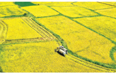
8月11日,在江西省宜春市上高县锦江镇墙上村,农民驾驶收割机收割稻谷。