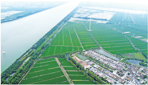
▲这是位于潮白河畔的小辛码头村(无人机照片,6月29日摄)。

一路探寻,一路体味。如今的小辛码头村村中有景、景中有村,田园风光、和美乡情相映成趣。“漕运文化”“了凡文化”“稻作文化”的传承与弘扬,为乡村旅游注入了内生动力,吸引着八方来客。(下转 8 版)