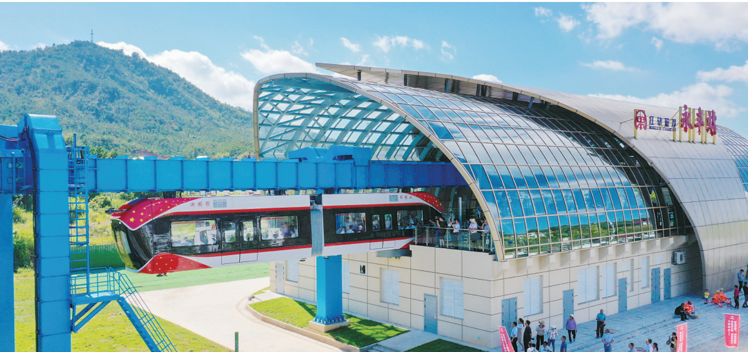
▲8月9日，“红轨”试验线列车驶出车站(无人机照片)。

新华社南昌8月9日电(记者陈毓珊、贾伊宁)9日，国内首条稀土永磁磁浮轨道交通工程试验线——“红轨”，在江西兴国县正式竣工，并实现将稀土永磁磁浮技术与空轨技术结合，建成中低速、中低运量的新制式轨道交通系统。 “红轨”试验线由江西理工大学牵头，与江西兴国县人民政府联合中铁六院、中铁工业、国家稀土功能材料创新中心等单位共同完成。正线全长约800米，均为钢构高架