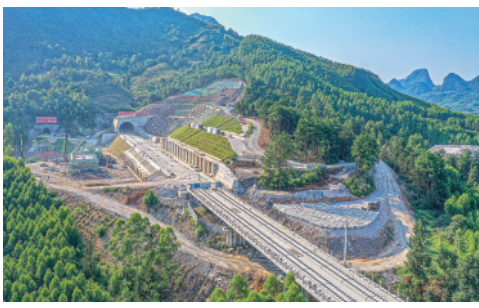
8月4日,贵南高铁大方山隧道顺利贯通。大方山隧道是贵南高铁广西段溶洞遇见率最高的隧道。