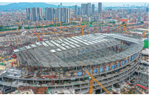
日前,广铁集团广州白云火车站完成一期工程主体部分施工。车站“云山珠水、木棉花开”的外观雏形初现。