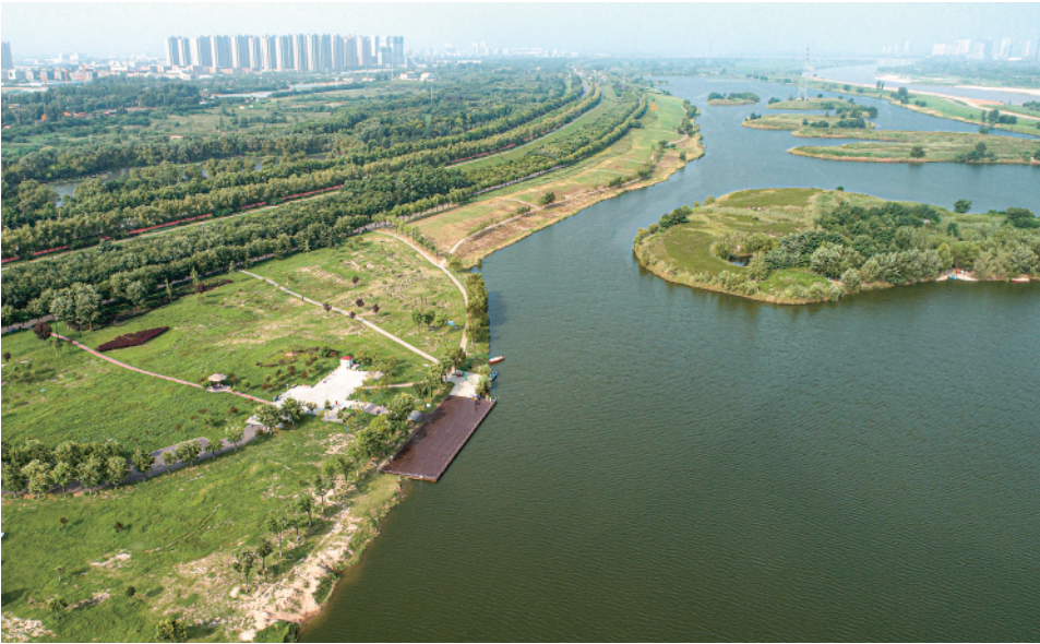
▲这是2022年7月31日拍摄的渭河西安段风光。