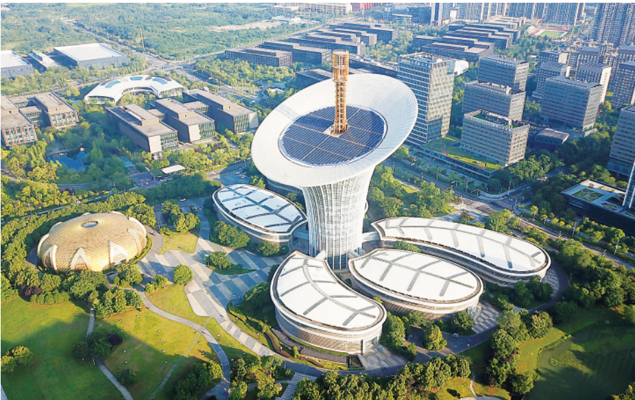
▲位于武汉光谷未来科技城的武汉新能源研究院大楼(2022年7月9日摄,无人机照片)。

两年前,2020年3月10日,在抗击新冠肺炎疫情的关键时刻,习近平总书记专门赴湖北省武汉市考察疫情防控工作,并称赞“武汉不愧为英雄的城市,武汉人民不愧为英雄的人民”。当年5月,习近平总书记参加十三届全国人大三次会议湖北代表团审议时强调,“希望湖北的同志统筹推进疫情防控和经济社会发展工作,坚持稳