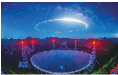
7月24日拍摄的“中国天眼”夜景(维护保养期间拍摄,无人机拍摄)。繁星之下,“中国天眼”呈现出别样美丽。