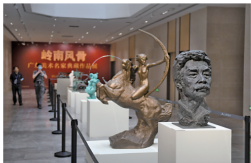
▲中国国家版本馆广州分馆里展出的雕塑作品(7月22日摄)。