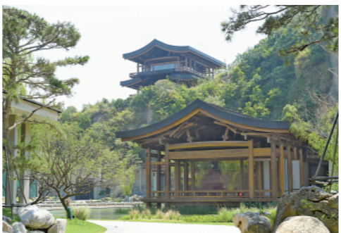
▲这是7月23日拍摄的杭州国家版本馆。