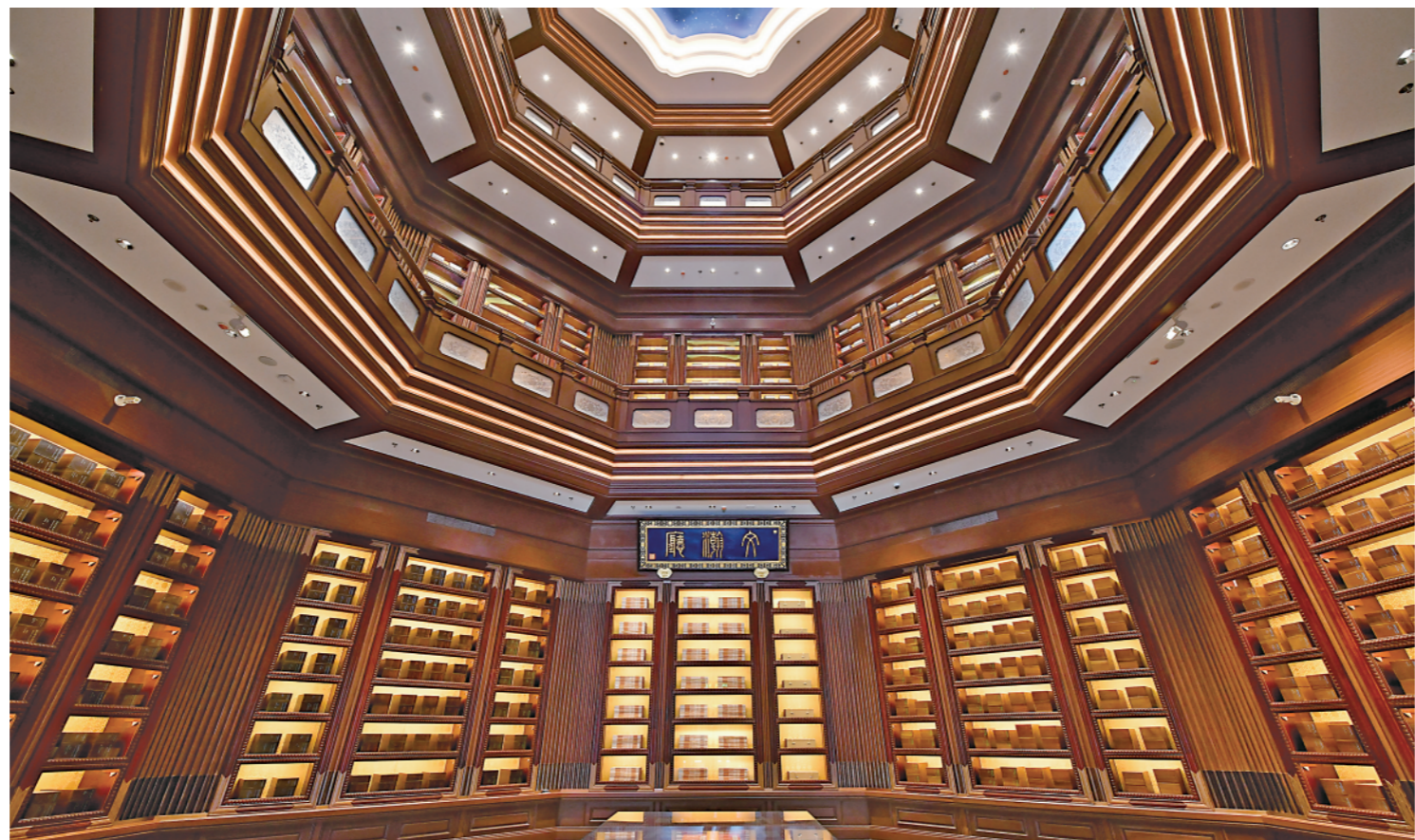
▲这是在北京拍摄的中国国家版本馆中央总馆文瀚阁文瀚厅(7月23日摄)。