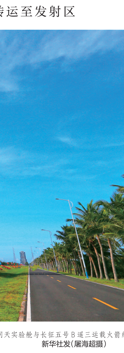
▲7月18日，问天实验舱与长征五号B遥三运载火箭组合体在转运途中。当日，问天实验舱与长征五号B遥三运载火箭组合体转运至发射区，将于近日择机实施发射。

国务院总理李克强将于19日出席世界经济论坛全球企业家视频特别对话会，发表致辞并同与会的各国企业家对话交流。 中共中央政治局委员、中组部部长陈希18日在北京与越共中央政治局委员、中组部部长张氏梅举行视频会谈。陈希表示，中国和越南是山水相连的社会主义友好邻邦，中方愿同越方全面落实习近平总书记和阮富仲总书记达成的重要共识，充分发挥党际交往特殊优势，推动两党在组织、干部等领域交流合作取得更加丰硕成果，以实际行动拓展中越全面战略合作伙伴关系的时代内涵。