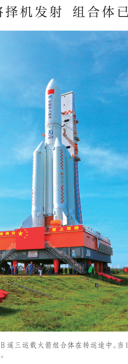
▲7月18日，问天实验舱与长征五号B遥三运载火箭组合体在转运途中。当日，问天实验舱与长征五号B遥三运载火箭组合体转运至发射区，将于近日择机实施发射。

三次会议，围绕“坚持实施就业优先政策”协商议政。会议还审议通过了政协全国委员会关于加强和改进新时代文史资料工作的意见和其他有关事项。 全国政协副主席兼秘书长李斌等就有关议题作了说明。全国政协副主席张庆黎、刘奇葆、万钢、卢展工、马飏、陈晓光、巴特尔、汪永清、苏辉、郑建邦、辜胜阻、刘新成、何维、邵鸿、高云龙出席会议。 府和社会各界要牢记习近平主席嘱托，把“着力提高治理水平”“不断增强发展动能”“切实排解民生忧难”“共同维护和谐稳定”落到实处。 与会专家学者深入开展研讨交流，一致认为习近平主席重要讲话科学回答了全面准确贯彻“一国两制”方针的重大理论和实践问题，应继续深入学习并以此指导新阶段港澳工作。 本次研讨会由全国港澳研究会主办，全国政协副主席何厚铤、梁振英，中央有关部门负责同志，香港特别行政区行政长官李家超、澳门特别行政区行政长官贺一诚，内地、香港、澳门有关人士和专家学者400余人出席。根据疫情防控要求，研讨会在香港、澳门、深圳设分会场，当地官员和专家学者通过视频连线方式参与研讨。