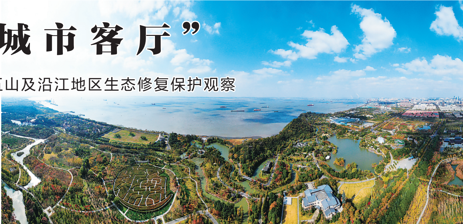
▲这是南通五山及沿江地区景色(2020年11月13日摄)。

口码头污染问题。南通痛定思痛,铁腕治污,全面实施生态修复保护工程,五山及沿江地区先后开展20多个专项整治行动,关停“散乱污”企业203家,清理“小杂船”162条(户),拆除河道周边违建6.5万平方米,腾退修复岸线12公里。