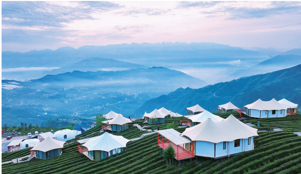
▲这是2022年4月20日拍摄的兴山县岩上茶居帐篷酒店。