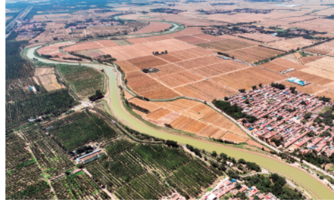
河北沧州东光县围绕大运河文化保护带、运河生态景观带,打造出美丽的运河画卷(6月24日摄)。

新华通讯社主管主办 2022年6月25日 星期六 壬寅年五月廿七 新华通讯社出版