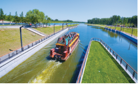
6月24日,京杭大运河京冀段全线62公里实现游船通航,标志着北京市第一次出现了跨省际航道。