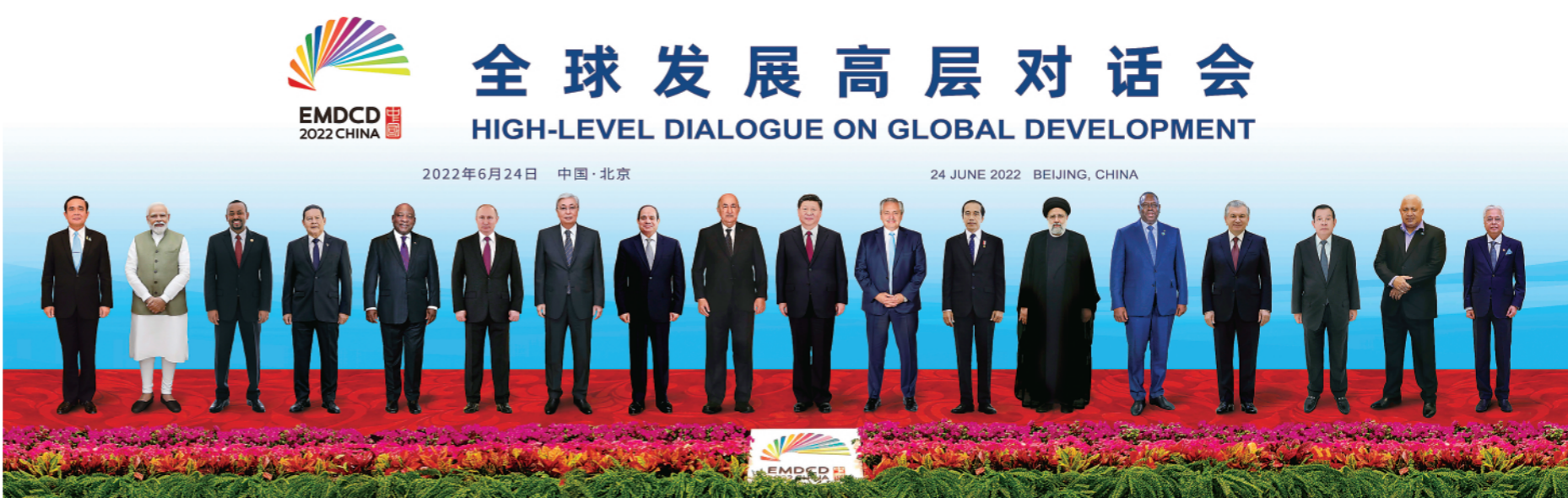
▲6月24日晚,国家主席习近平在北京以视频方式主持全球发展高层对话会并发表题为《构建高质量伙伴关系 共创全球发展新时代》的重要讲话。这是与会各国领导人的“云合影”。

新华社北京6月24日电(记者杨依军)国家主席习近平24日晚在北京以视频方式主持全球发展高层对话会并发表重要讲话。阿尔及利亚总统特本、阿根廷总统费尔南德斯、埃及总统塞西、印度尼西亚总统佐科、伊朗总统莱希、哈萨克斯坦总统托卡耶夫、俄罗斯总统普京、塞内加尔总统萨迪奥·盖伊、南非总统拉马福萨、乌兹别克斯坦总统米尔济约耶夫、巴西副总统莫朗、柬埔寨首相洪森、埃塞俄比亚总理阿比、斐济总理姆拜尼马拉马、印度总理莫迪、马来西亚总理伊斯迈尔、泰国总理巴育出席。各国领导人围绕“构建新时代全球发展伙伴关系,携手落实2030年可持续发展议程”的主题,就加强国际发展合作、加快落实联合国2030年可持续发展议程等重大问题深入交换意见,共商发展合作大计,达成广泛重要共识。人民大会堂金色大厅灯光璀璨,18个与会国国旗熠熠生辉。晚8时许,习近平宣布对话会开始。与会各国领导人一同观看视频短片,重温新兴市场国家和发展中国家近年来合作的重要时刻。当十八国领导人“云合影”照片出现在大屏幕上时,现场响起热烈掌声。习近平发表题为《构建高质量伙伴关系 共创全球发展新时代》的重要讲话。