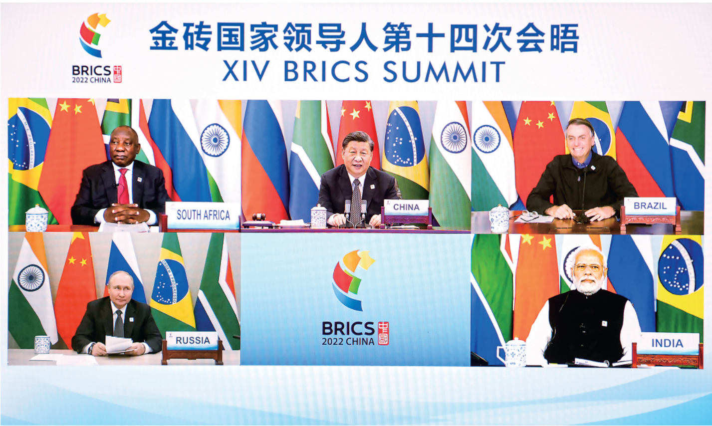
▲6月23日晚,国家主席习近平在北京以视频方式主持金砖国家领导人第十四次会晤并发表题为《构建高质量伙伴关系 开启金砖合作新征程》的重要讲话。南非总统拉马福萨、巴西总统博索纳罗、俄罗斯总统普京、印度总理莫迪出席。

新华社北京6月23日电(记者杨依军)国家主席习近平23日晚在北京以视频方式主持金砖国家领导人第十四次会晤。南非总统拉马福萨、巴西总统博索纳罗、俄罗斯总统普京、印度总理莫迪出席。