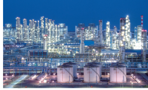
这是全球单体规模最大的煤制油项目——宁夏煤业公司400万吨煤制油项目夜景(6月22日摄)。

今日16版 总第10768期 / 国内统一连续出版物号CN 11-0209 邮发代号1-19 / 新华网:news.cn 新华每日电讯网:mr dx.cn