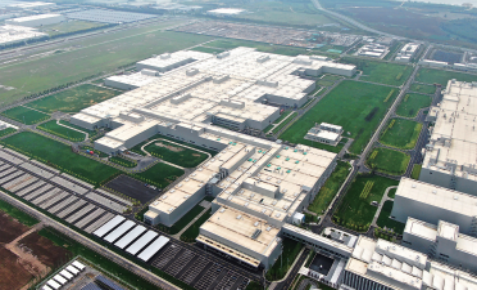
6月23日,华晨宝马里达工厂正式开业。里达工厂位于沈阳市铁西区,总投资达150亿元人民币。