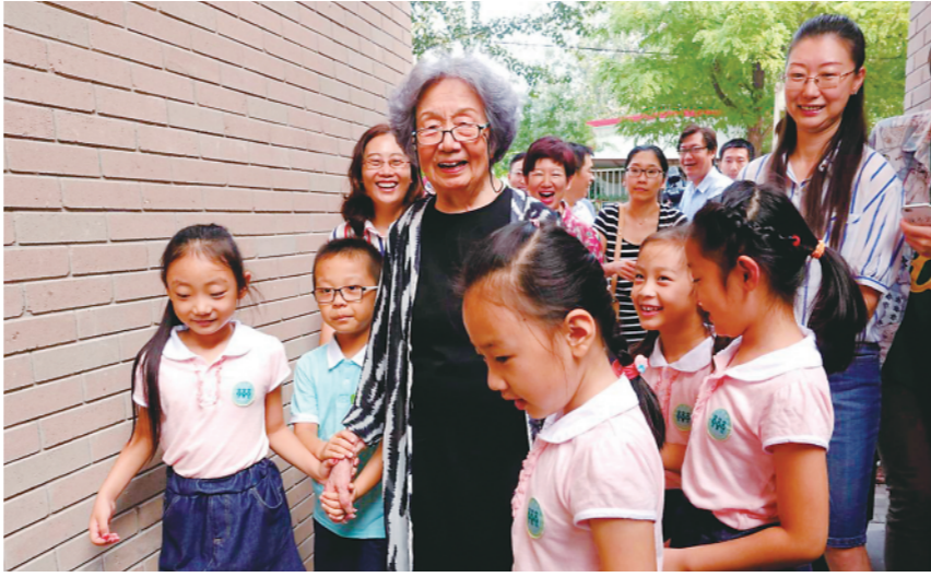
▲ 2016年教师节，小朋友们为叶嘉莹先生送去节日祝福。

妇女织出布来也要纳税，所以嘉陵江的女子织出花布，要向国家纳税。“巴人讼芋田”，“巴”是古代四川这个地方一个国家的名字。