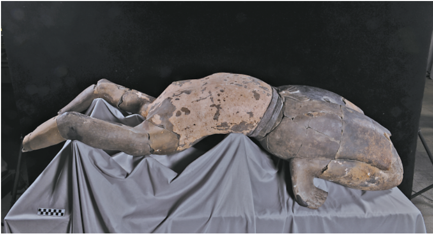
▲这是被修复的“28号俑”。

同的是，百戏俑坑是象征着秦代宫廷娱乐杂技的机构。“28号俑”出土于秦始皇陵K9901百戏俑陪葬坑中部，发掘时残破非常严重，由数十块残片组成，其头部及双手缺失。“28号俑”的保护修复共历时9个多月时间，修复完成后俑身通长154厘米，重101.4公斤。