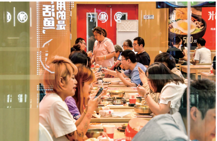
▲6月9日，市民在丰台区一家商场内购物休闲。