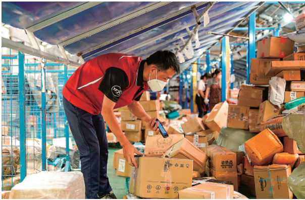
▲6月8日，圆通速递上海市北桥网点，一名快递员在进行包裹分拣。