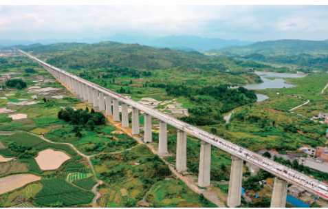
近日,工人们在贵州省独山县境内贵南高铁拉里双线特大桥建设现场进行无砟轨道施工(6月2日摄)。