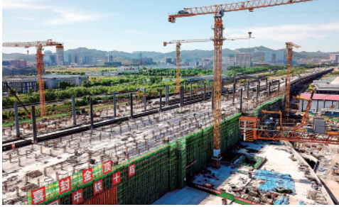
6月6日,济(南)莱(芜)高铁历城站混凝土主体结构提前完成封顶作业,后续建设正有序推进中。